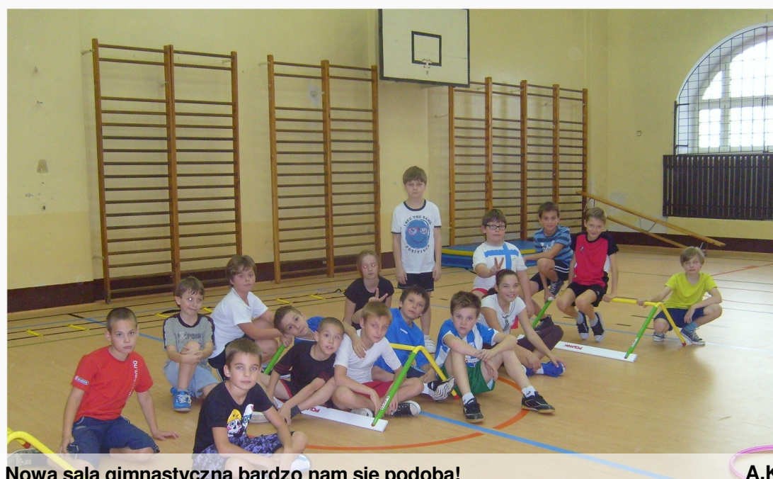
Nowa sala gimnastyczna bardzo nam się podoba!