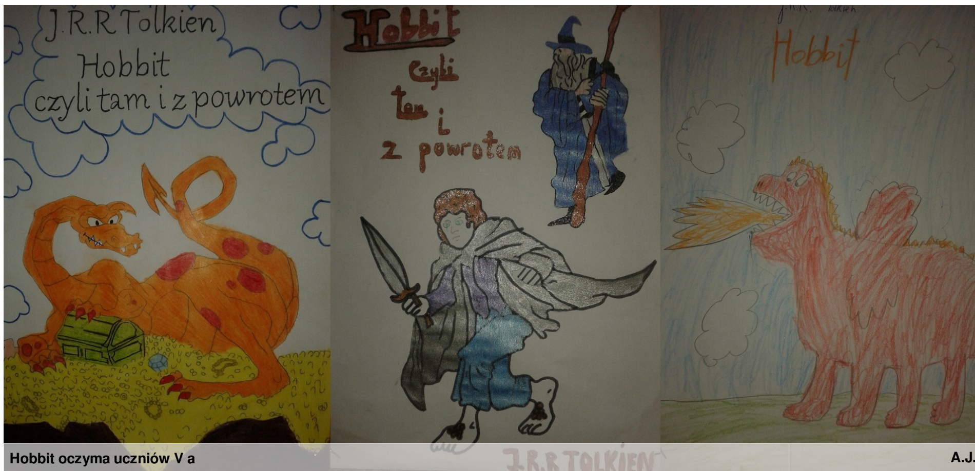
Hobbit oczyma uczniów V a