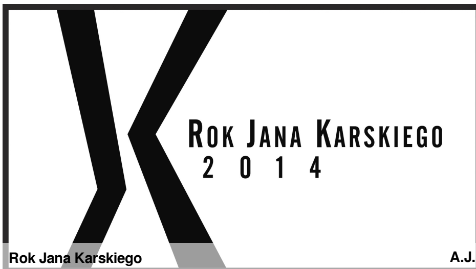
Rok Jana Karskiego