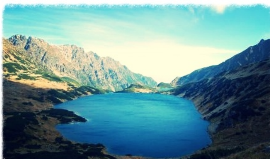
Sporty ekstremalne kojarzą się z gorami