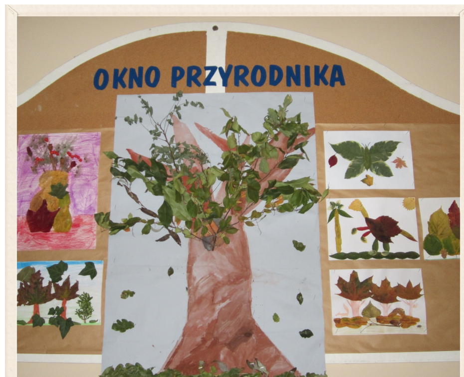
Co słycać w świecie przyrody?

Jan Karski wyruszył w kolejną misję, tym razem do Wielkiej Brytanii i Stanów Zjednoczonych. Jednym z jego głównych zadań było poinformowanie aliantów o tragicznej sytuacji ludności żydowskiej. Zbierając informacje na ten temat, dwukrotnie przedostał się do warszawskiego getta.