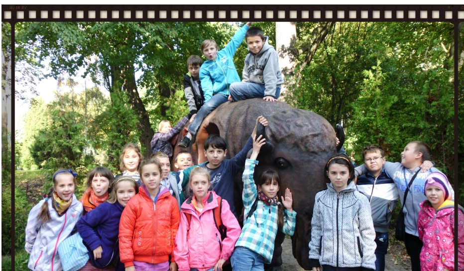
W ogrodzie zoobotanicznym