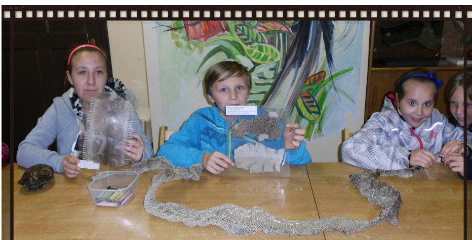
Nie taki gad straszny