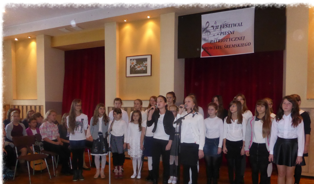
Nasz zespół na VII Powiatowym Festiwalu Pieśni Patriotycznej