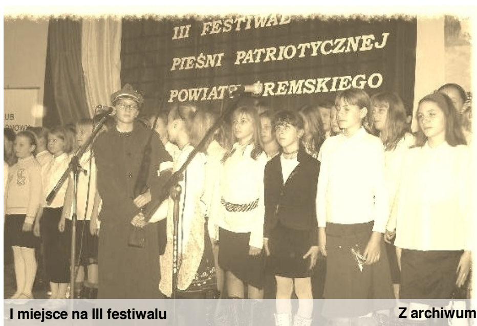
I miejsce na III festiwalu