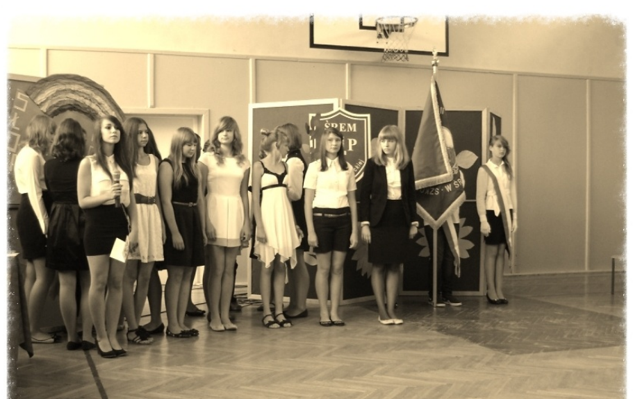
Podczas uroczystości szkolnych