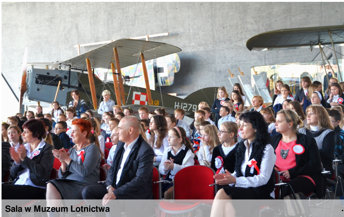
Sala w Muzeum Lotnictwa

Warto poszukać autorytetów, wzorów godnych naśladowania, pięknych historii sprzed lat, poruszyć serca i wyobraźnię, odnaleźć pasje.