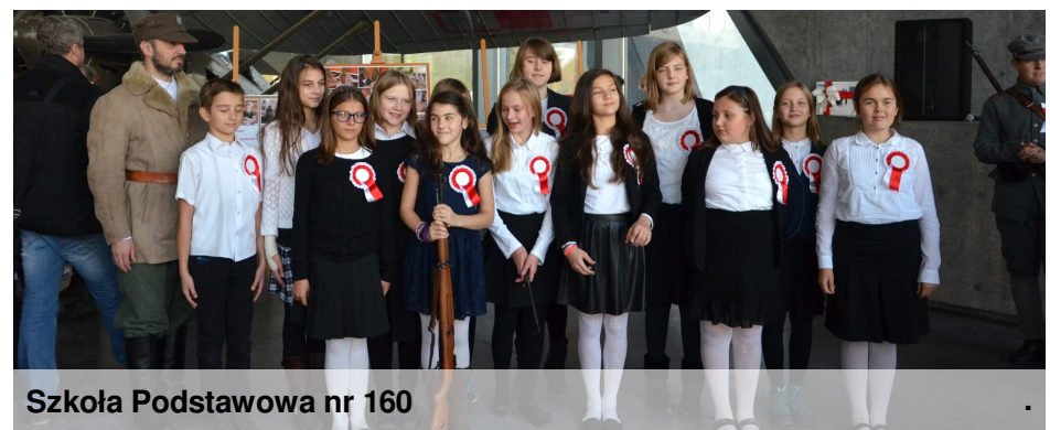
Szkoła Podstawowa nr 160