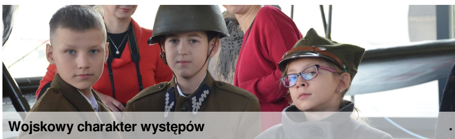
Wojskowy charakter występów

Coś dla ciała, coś dla ducha - urozmaicony program Eskadrylli . Zaduma, podziw i nostalgia, ale także radość i zabawa. Święto w biało - czerwonym kolorze. Uczta dla duszy, ale i dla podniebienia - czyli historia grochówki.