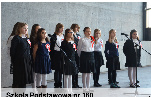
.Szkoła Podstawowa nr 160