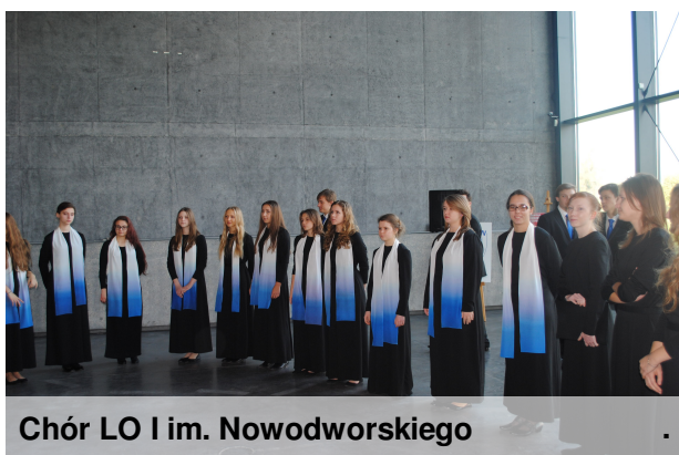
Chór LO I im. Nowodworskiego

Publiczność mogła zachwycać się profesjonalnym wykonaniem pieśni patriotycznych znanych i podziwianych od lat. Dziękujemy mistrzom.