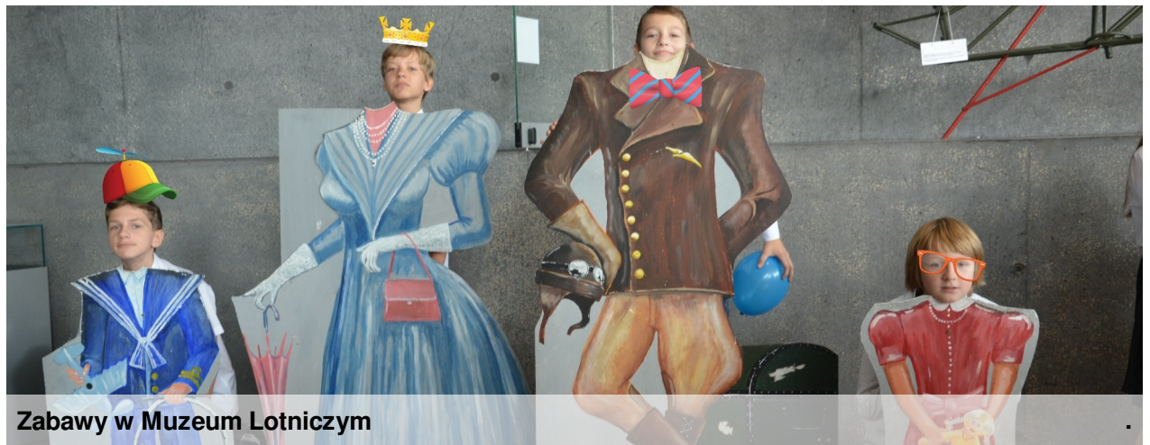
Zabawy w Muzeum Lotniczym