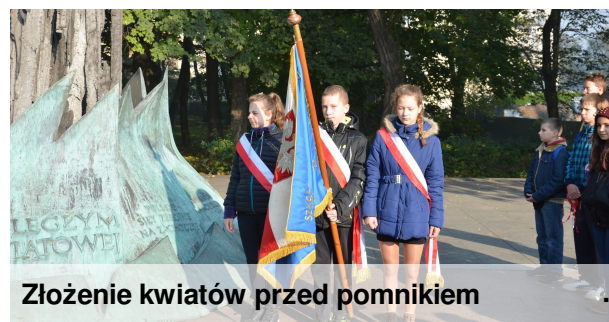
Złożenie kwiatów przed pomnikiem

Żołnierze z desantu zaskoczyli swym przygotowaniem i zaangażowaniem. Ich pokazy cieszyły się zainteresowaniem ze strony najmłodszych i płci pięknej.