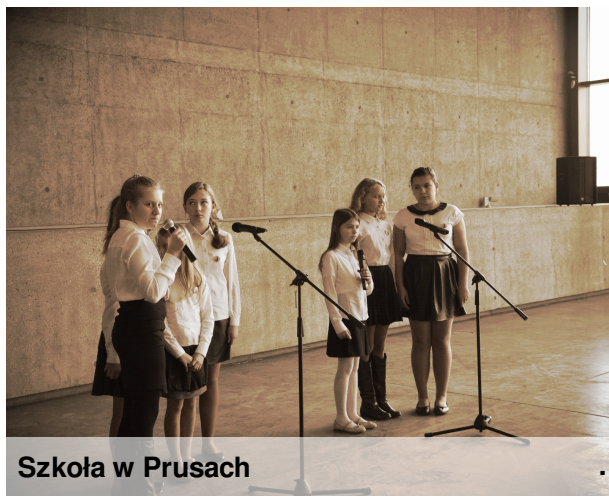
Szkoła w Prusach