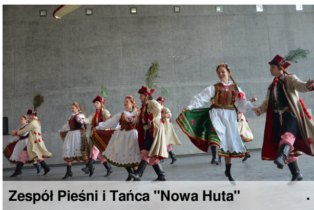
Zespół Pieśni i Tańca "Nowa Huta"

Młodzież w krakowskich strojach regionalnych zaprezentowała najbardziej charakterystyczne układy taneczne. Niech żyje młodość!