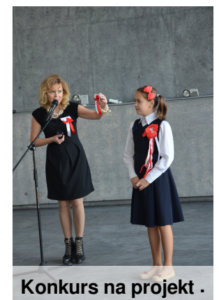
Konkurs na projekt