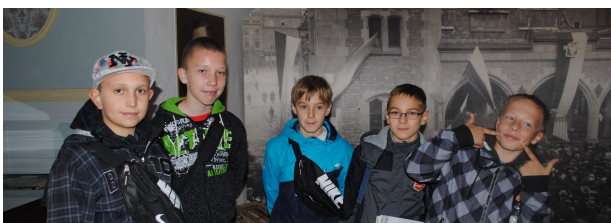
Wizyta na kopcu Kościuszki

poszukiwali wskazówek do rozwiązania zagadki. To tam uczniowie usłyszeli o odwachu, roli Antoniego Stawarza zobaczyli galerię figur woskowych postaci związanych z ideą odzyskania niepodległości przez Polskę. Następnie ruszyli w poszukiwaniu emisariusza, który przekazał im ustnie kolejne polecenie. Musieli udać się do tablicy upamiętniającej wyruszenie Legionów Polskich Piłsudskiego po niepodległość. A potem było już niebezpiecznie. Uczestnicy gry zostali zamknięci przez stróża w twierdzy Kleparz.