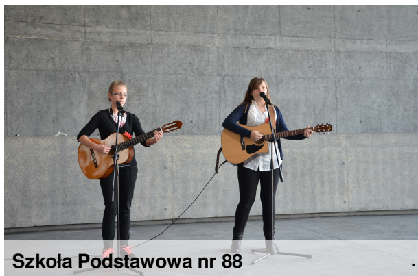
Szkoła Podstawowa nr 88