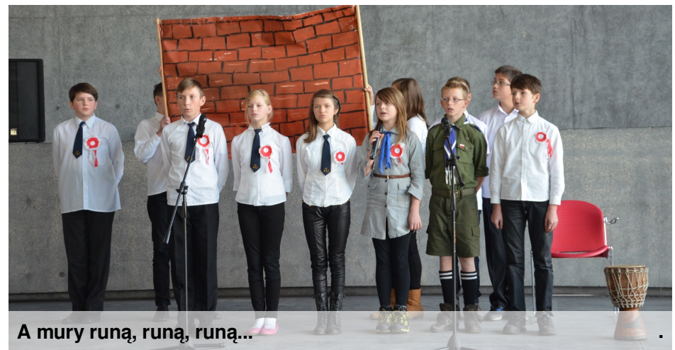
A mury runą, runą, runą...