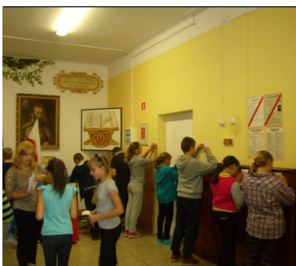
Wybory do Samorządu Uczniowskiego

Życzę wszystkim członkom samorządu szkolnego szczęścia w nowym roku szkolnym, miłych kolegów oraz ciekawych pomysłów