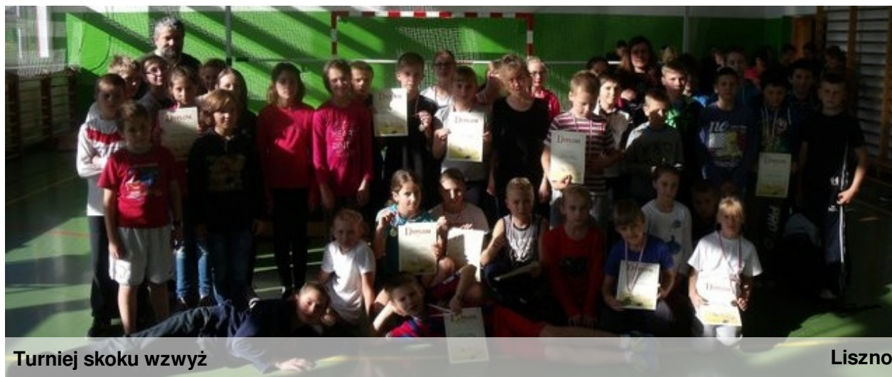
Turniej skoku wzwyż