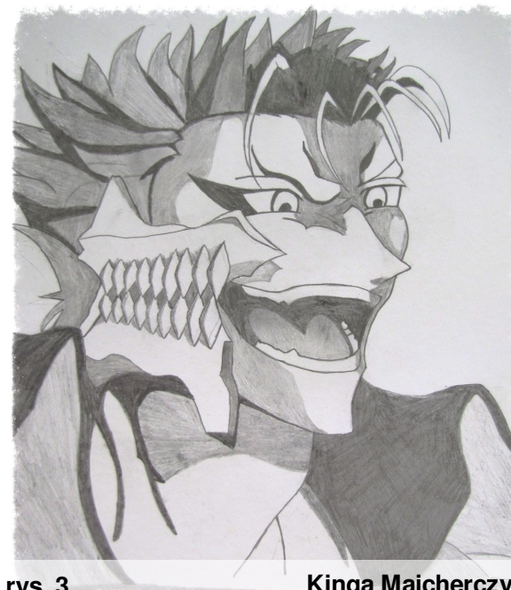
rys. 3 Kinga Maicherczyk