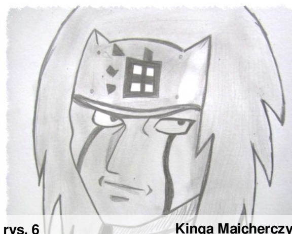
rys. 6 Kinga Maicherczyk