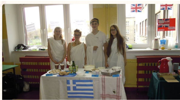
Potrawy kuchni greckiej Gim7 w Chorzowie

W dniu 06.11.2014 mogliśmy spróbować dań z czterech kolejnych krajów. Były to Hiszpania, Grecja, Anglia oraz Francja. Na hiszpańskim stole pojawiły się Tapas czyli przystawki, na stole