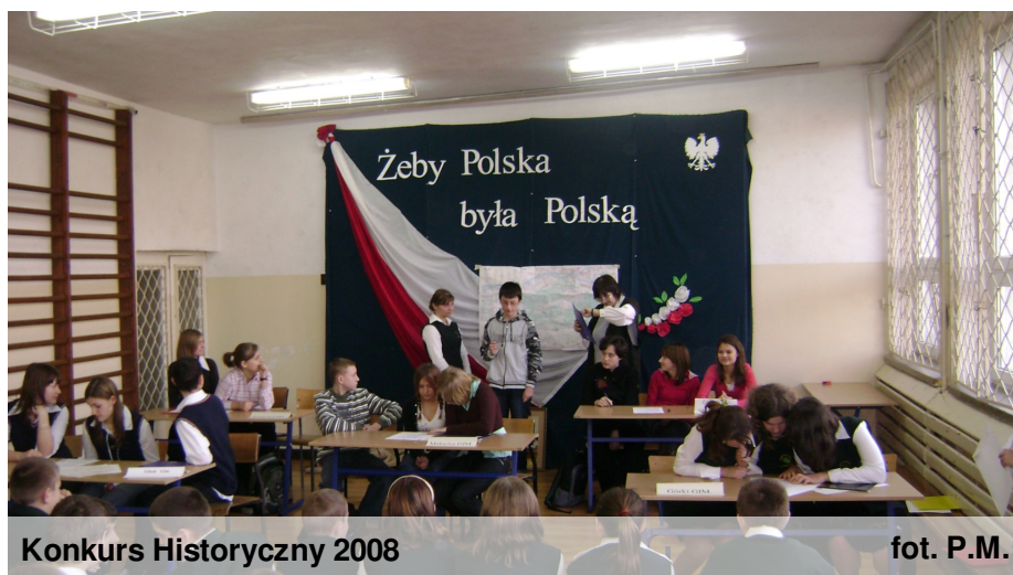
Konkurs Historyczny 2008