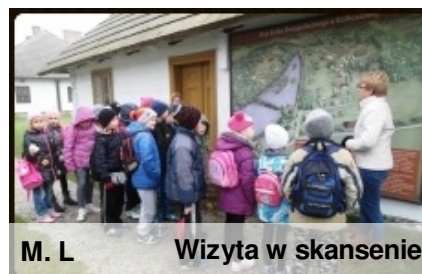
M. L Wizyta w skansenie

Pod koniec października uczniowie kl. II i III odwiedzili Muzeum Kultury Ludowej w Kolbuszowej. Była to niezapomniana podróż w dawne czasy, kiedy chaty budowane były z drewna, zboże żęto sierpem, a ziarno na mąkę mielono w żarnach.