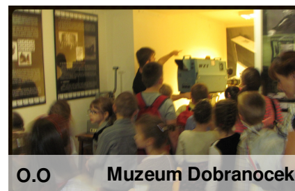
O.O Muzeum Dobranocek

Wycieczka sprawiła dzieciom wiele przyjemności. Wszyscy wrócili zadowoleni, uśmiechnięci i podekscytowani.