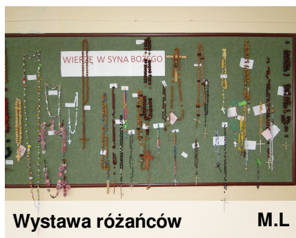
Wystawa różańców M.L

Październik to wyjątkowy miesiąc. Tradycyjnie w każdej parafii organizowane są nabożeństwa różańcowe. W tym roku już po raz drugi ks. M. Kilar zorganizował konkurs szkolny na najciekawsze różańce wykonane dowolną techniką. Podobnie jak w roku minionym, tak i teraz w konkursie wzięły udział dzieci z klas I - VI. Wykonano 37 ślicznych różańców. Organizatorzy za najciekawsze uznali prace wykonane z orzechów, ciasta, kwiatków, cukierków, nakrętek, guzików czy żółędzi.