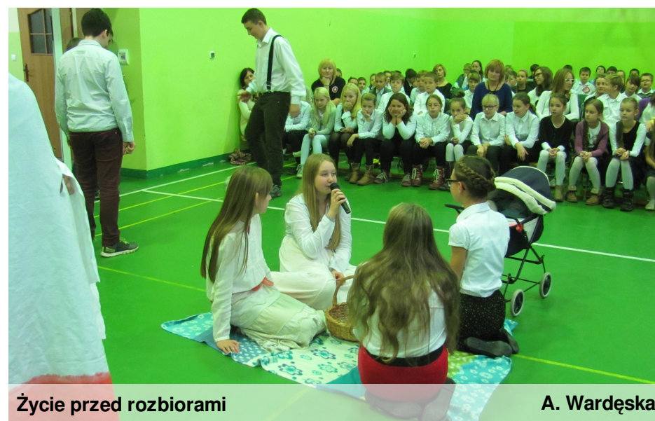
Życie przed rozbiorami