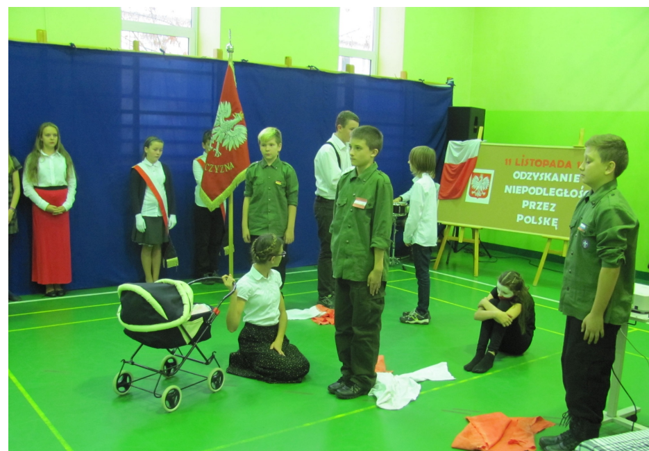
Życie w rozbiorach

Niech żyje Polska! Niech żyje niepodległość!