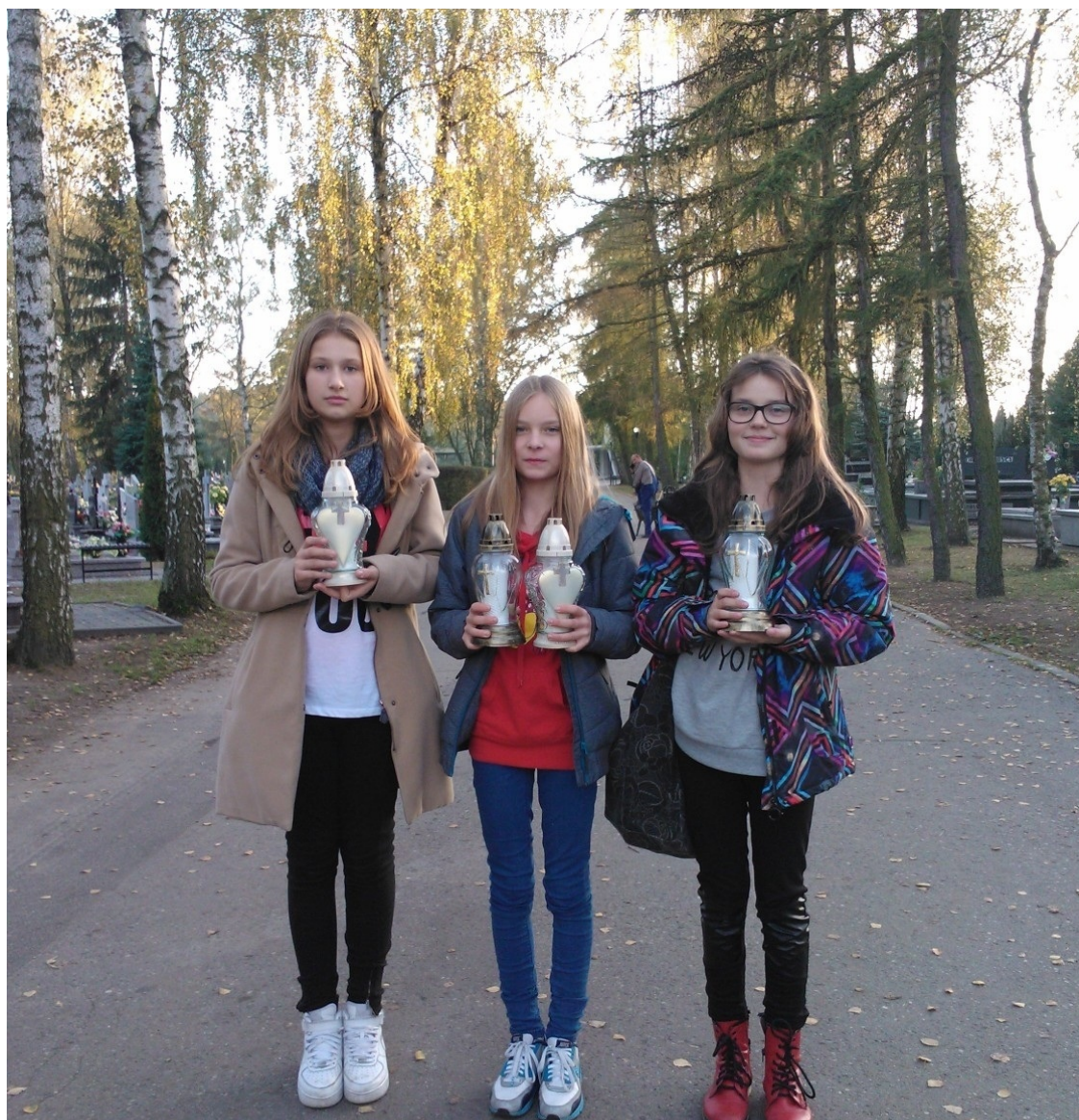
Przedstawicielki Samorządu Uczniowskiego