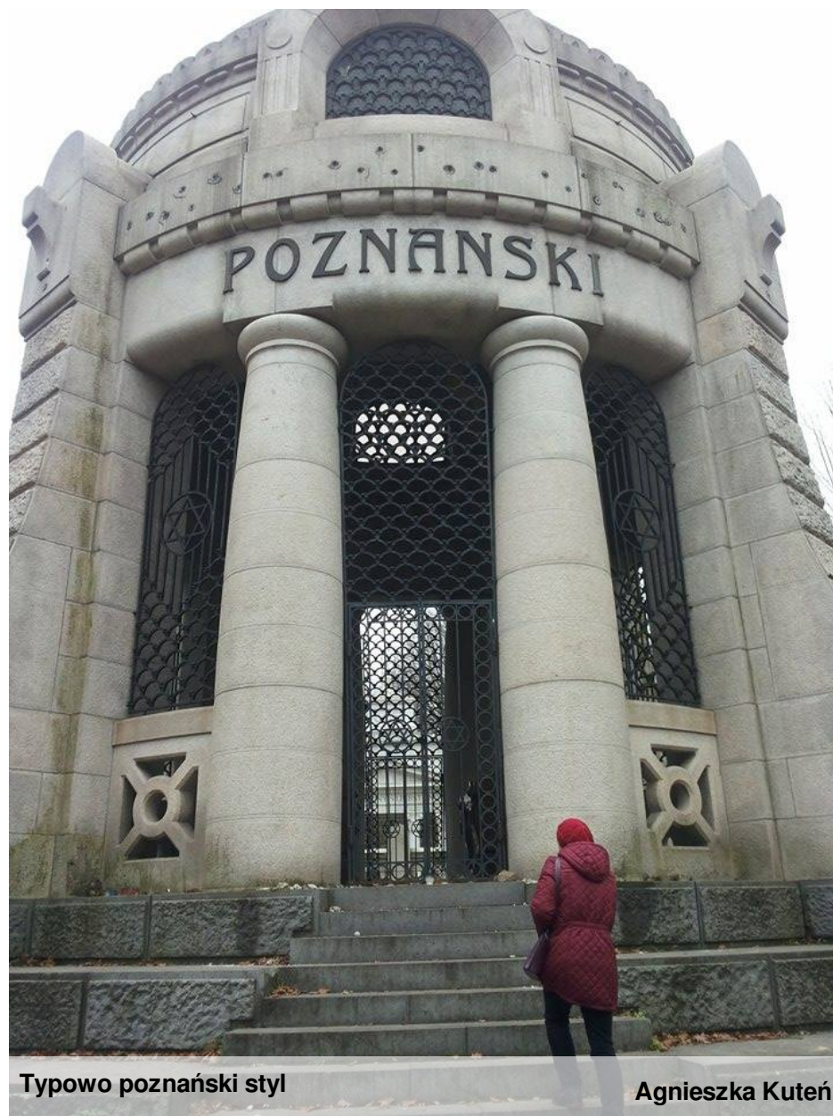
Typowo poznański styl