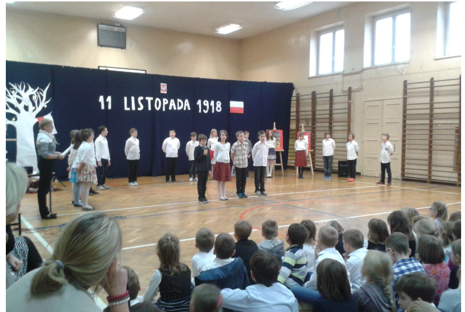
Uroczystość Odzyskania Niepodległości

Poculiśmy go, kiedy Polska została mistrzami świata w siatkówce, kiedy Małysz skakał najdalej, gdy siedemnastoletnia Polka dokonała przełomu w leczeniu raka trzustki, kiedy polski papież był ogłaszany świętym. To jest nasz patriotyzm i nie możemy go stracić.