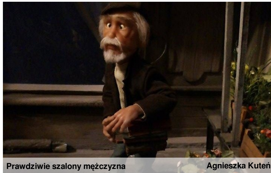
Prawdziwie szalony mężczyzna