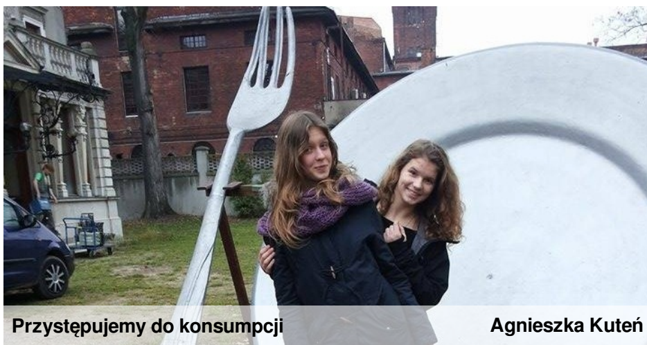
Przystępujemy do konsumpcji