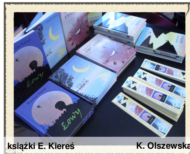
książki E. Kiereś