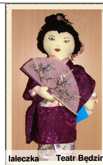
laleczka Teatr Będzin