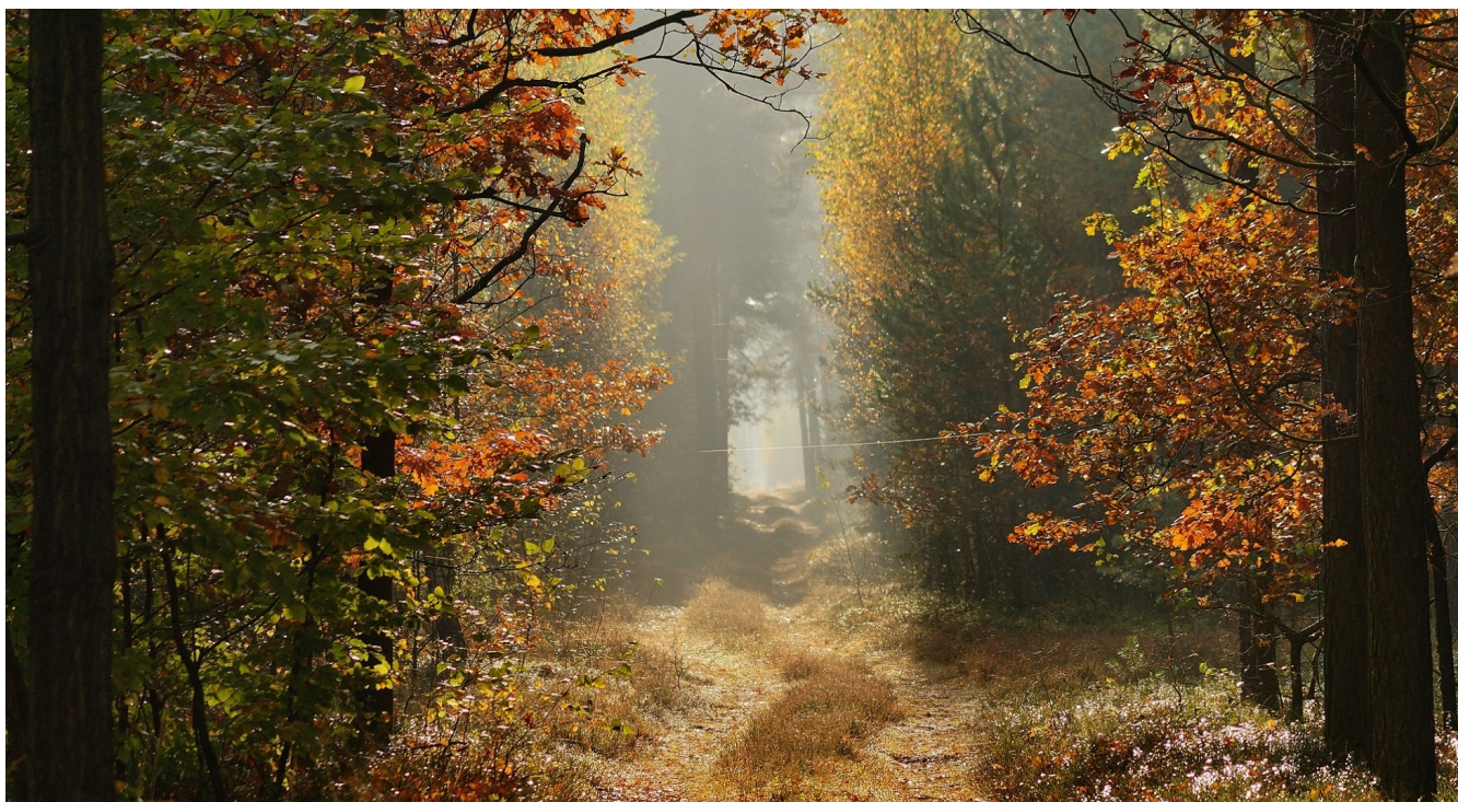
W głąb lasu III