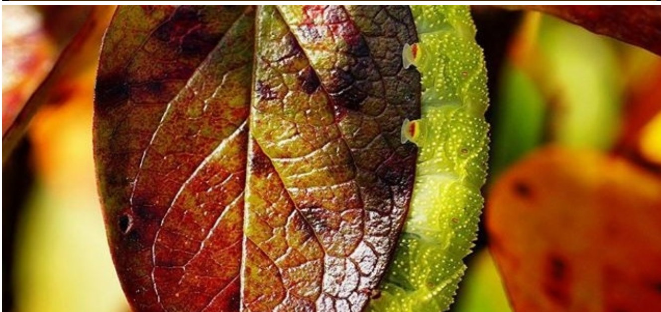
W głąb lasu II