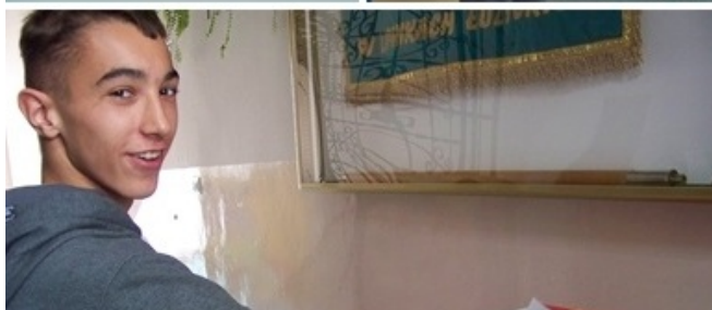
Wybory do SU