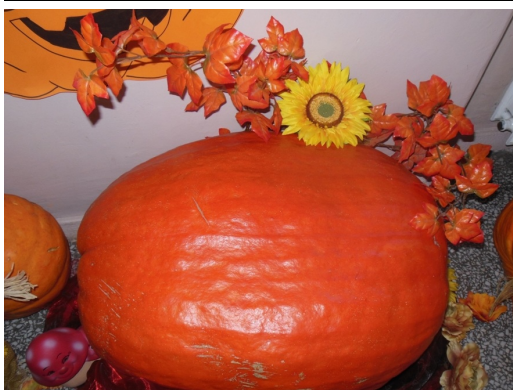
Dynia Klasy V