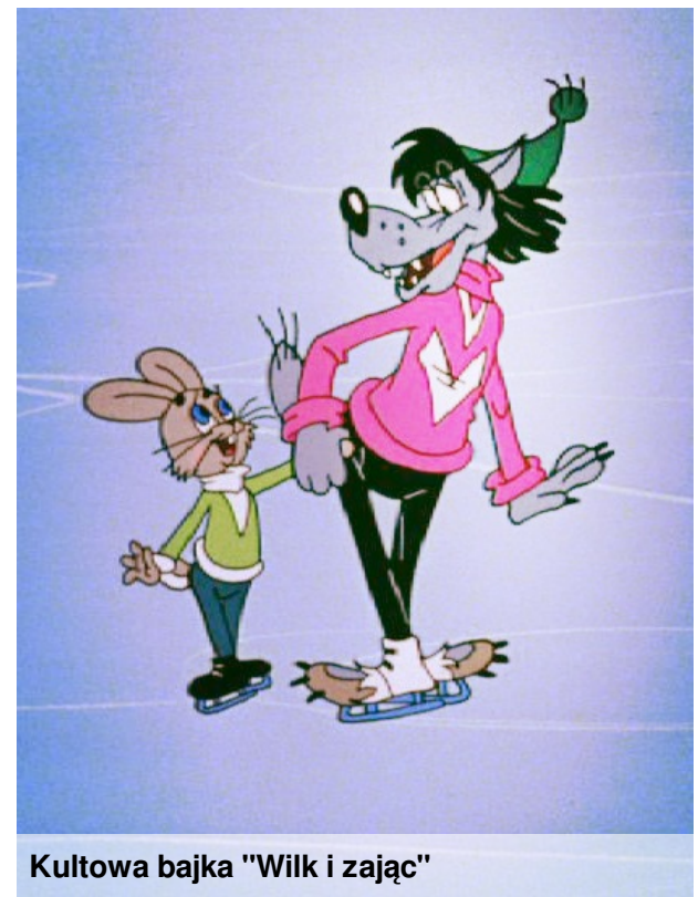
Kultowa bajka "Wilk i zając"