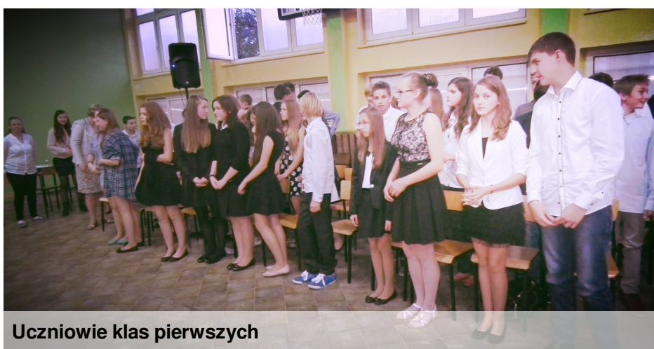
Uczniowie klas pierwszych