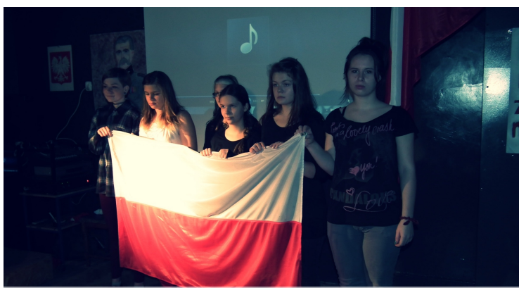
Końcowa scena etiudy

12 listopada w naszej szkole uczniowie upamiętnili odzyskanie przez Polskę niepodległości, uczestnicząc w przedsięwzięciu dydaktycznym, któremu przyświecały słowa samego Józefa Piłsudskiego: „Być zwyciężonym i nie ulec, to zwycięstwo, zwyciężyć i spocząć na laurach, to klęska.”