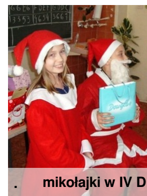
mikołajki w IV D