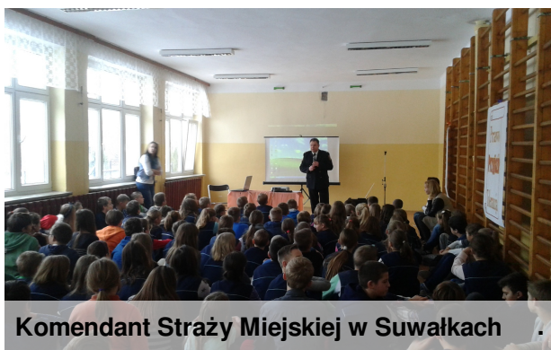
Komendant Straży Miejskiej w Suwałkach