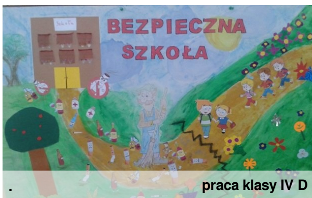
praca klasy IV D