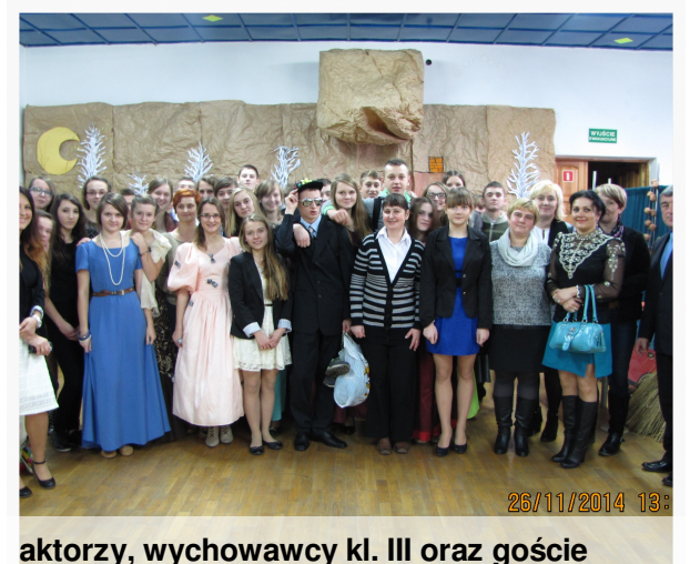
aktorzy, wychowawcy kl. III oraz goście