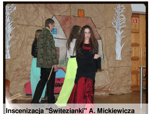
Inscenizacja "Świtezianki" A. Mickiewicza