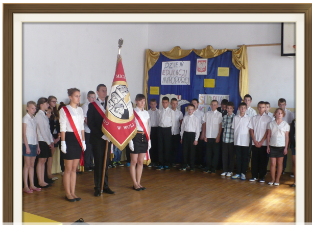
Uroczyste ślubowanie klasy pierwszej