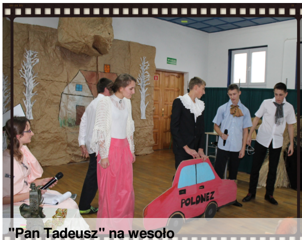
"Pan Tadeusz" na wesoło