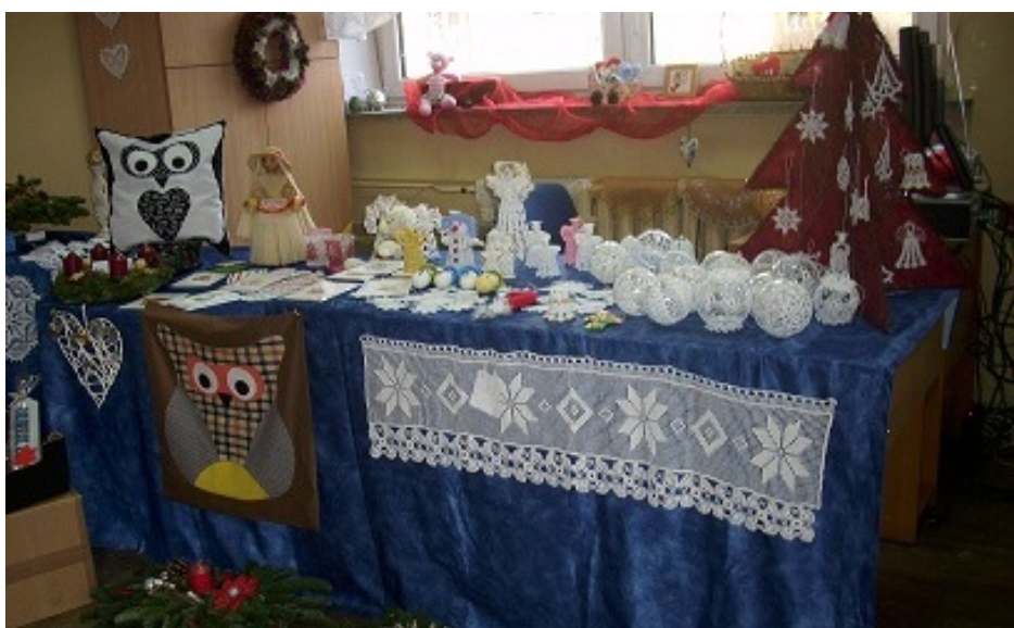
Wystawa rękodziela w bibliotece szkolnej