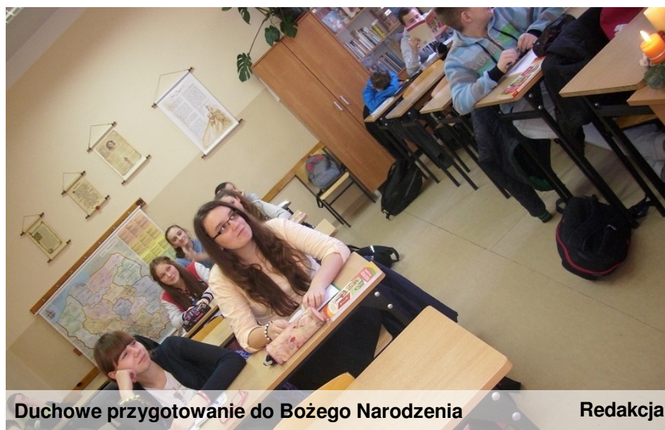
Duchowe przygotowanie do Bożego Narodzenia