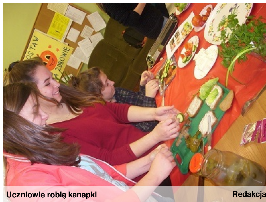
Uczniowie robią kanapki