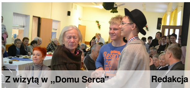
Z wizytą w „Domu Serca”