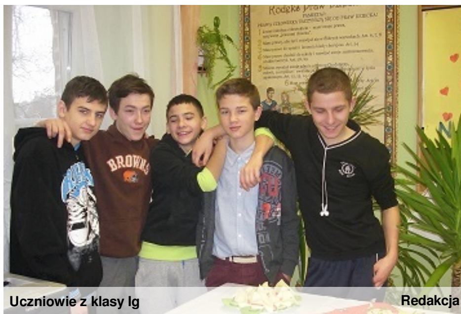
Uczniowie z klasy 1g