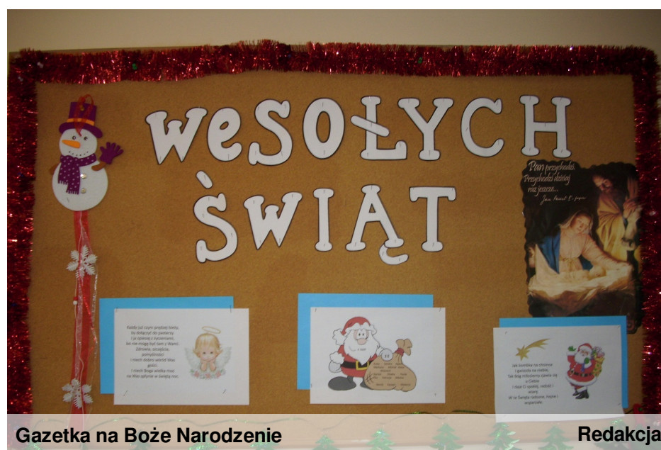
Gazetka na Boże Narodzenie