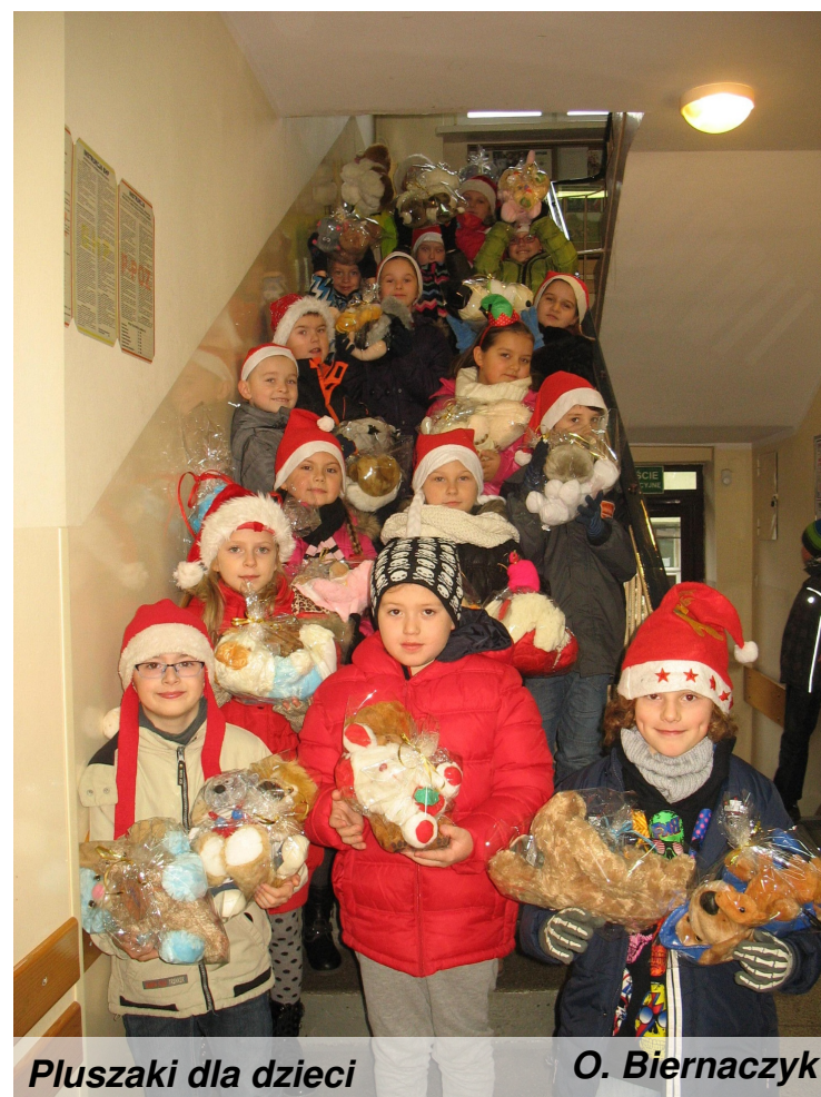
Pluszaki dla dzieci

Również na plastyce pani ogłosiła świąteczny konkurs na anioła w przestrzeni. Technika pracy była dowolna, więc niektórzy wykonali anioła z masy solnej lub gazety, inni zaś ze styropianu. Wyniki już niebawem!