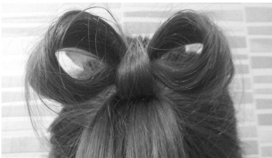
Kucyk z kokardką