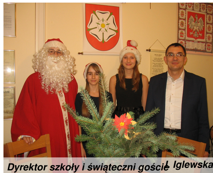
Dyrektor szkoły i świąteczni goście Iglewska

Zwyczajem lat poprzednich również w tym roku w "Szóstce" zagościł Mikołaj wraz ze swoimi pomocniczkami. Wszyscy grzeczni uczniowie zostali przez nich obdarowani świątecznymi słodkościami pod warunkiem, że wspólnie zaśpiewają kolędę. Chętnie też korzystano z okazji sfotografowania się ze świątecznymi gośćmi. Tej pokusie nie oparł się nawet sam Pan Dyrektor!