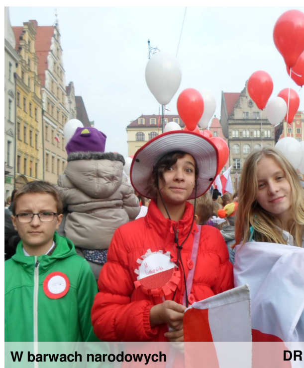
W barwach narodowych