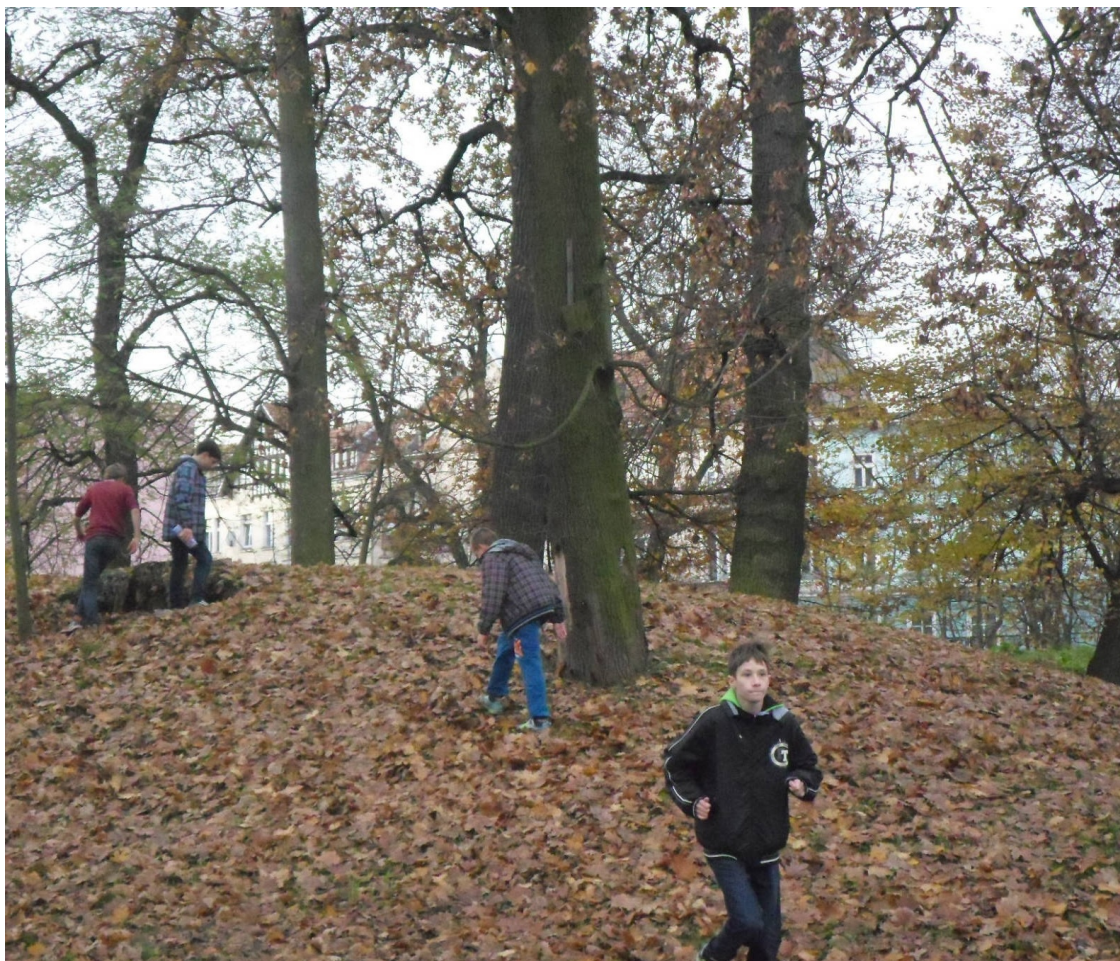
Poszukiwanie słodkiego skarbu

wierszyków, a później przy użyciu ogromnego kolorowego ołówka pasowała kolejno nowych uczniów Gimnazjum nr 12.