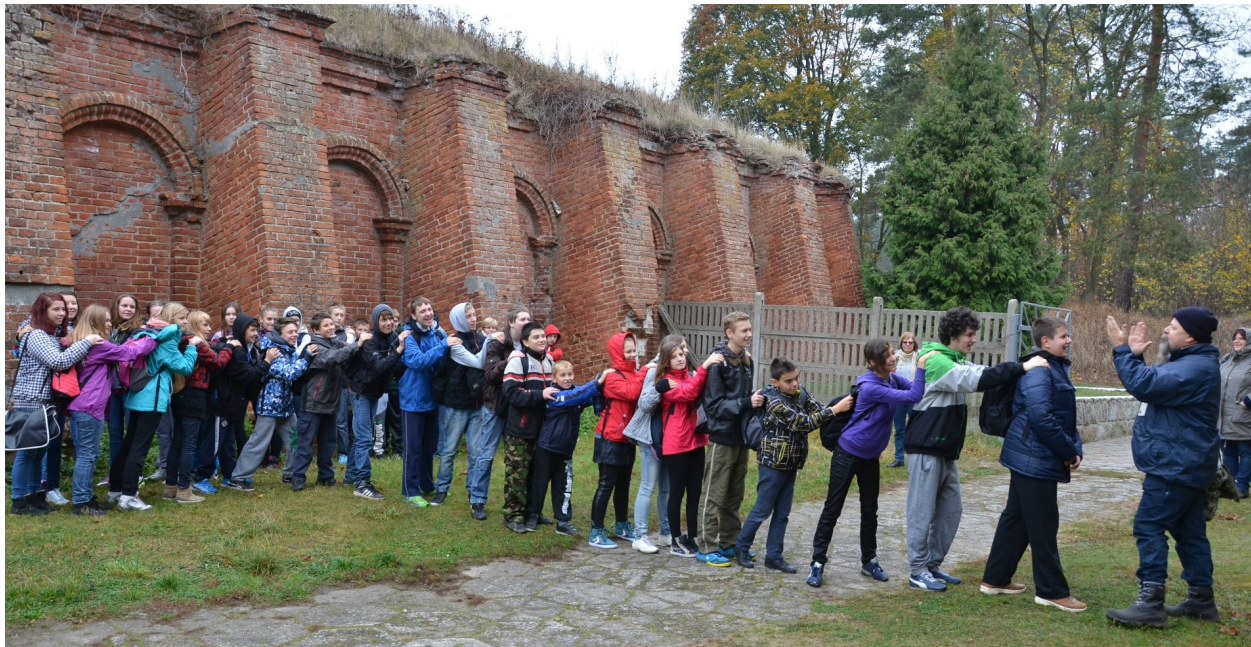
Twierdza w Osowcu