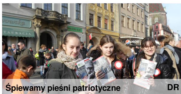
Śpiewamy pieśni patriotyczne