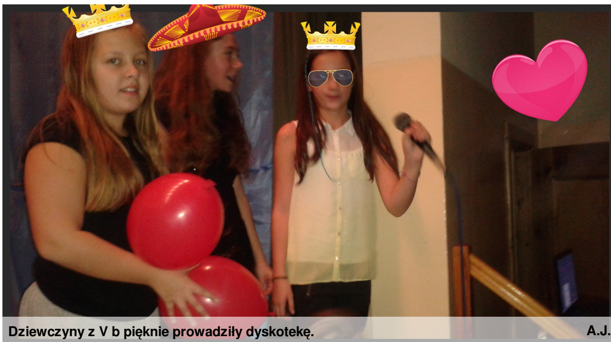
Dziewczyny z V b pięknie prowadziły dyskotekę.