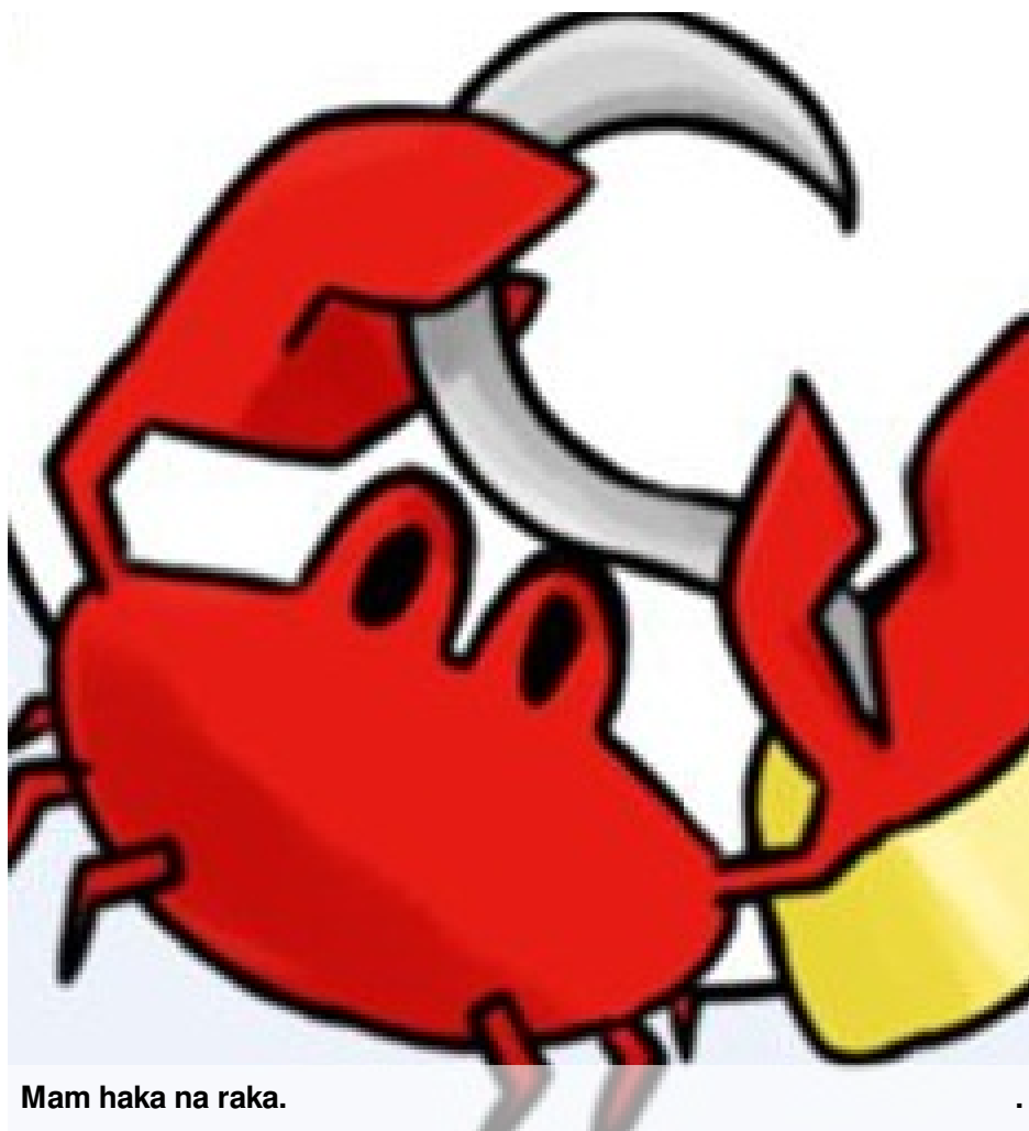
Mam haka na raka.