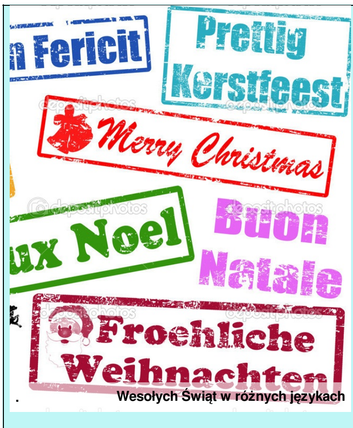
Wesołych Świąt w różnych językach