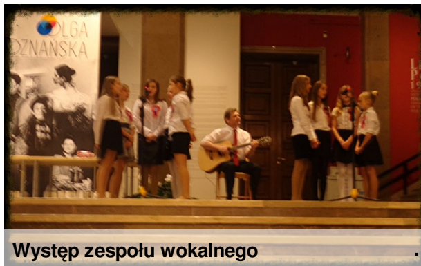
Występ zespołu wokalnego