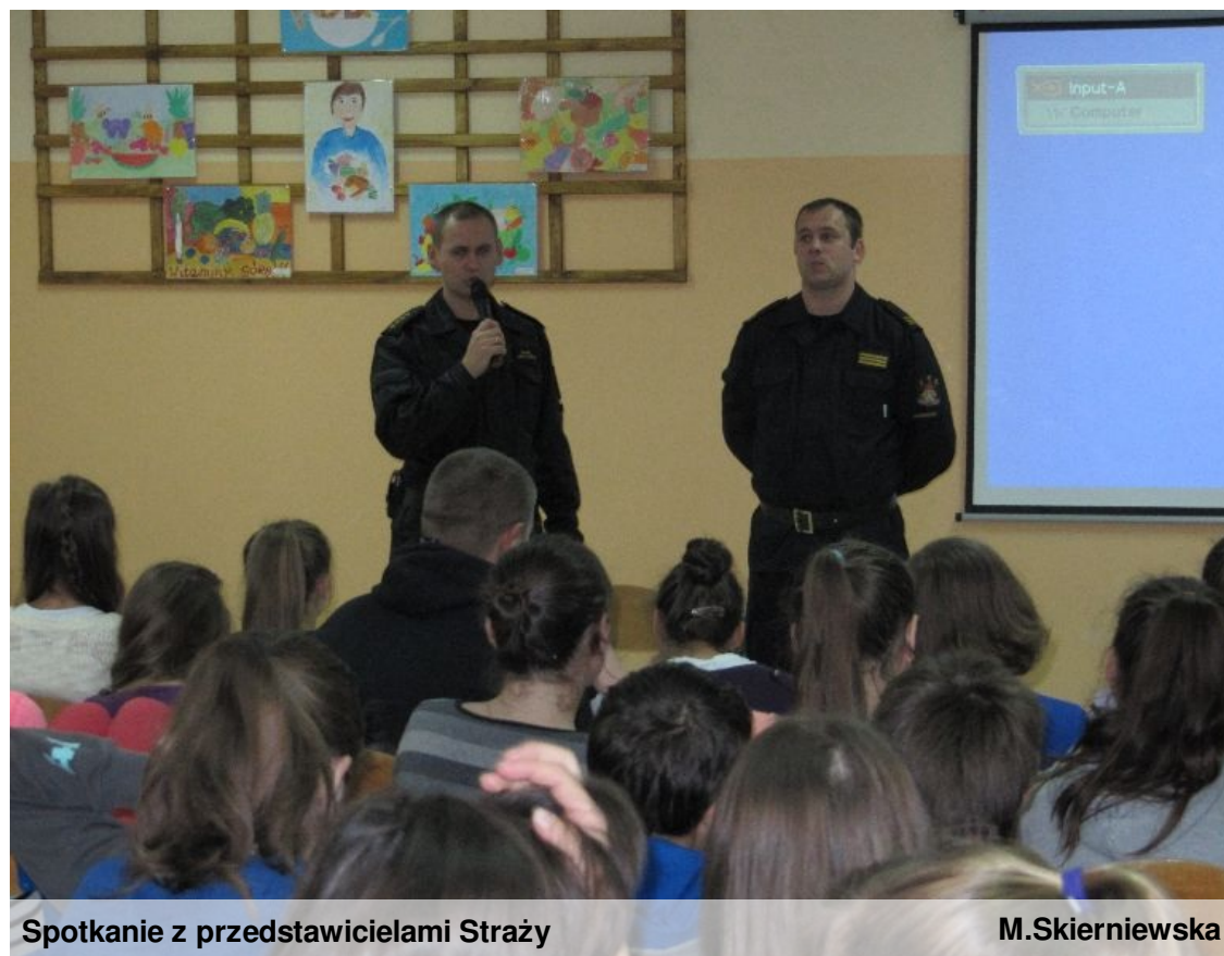
Spotkanie z przedstawicielami Straży