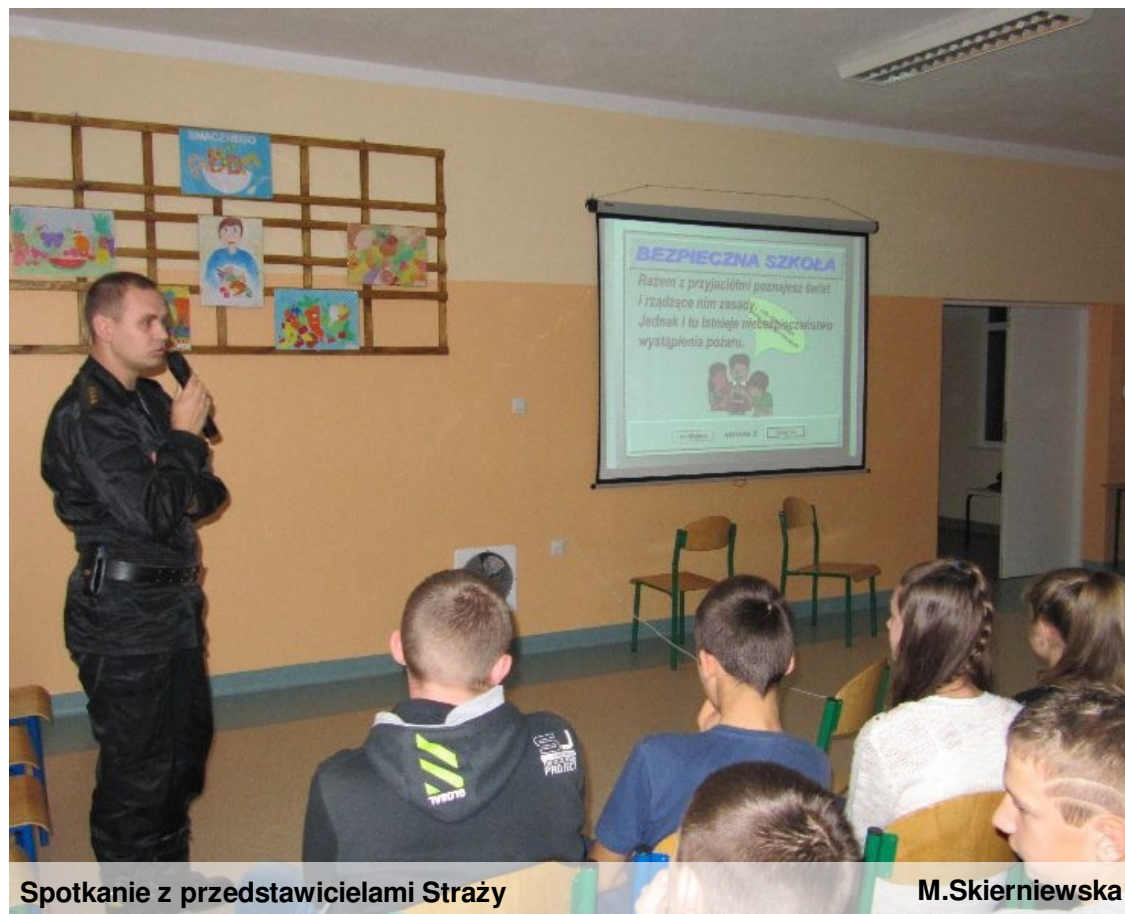
Spotkanie z przedstawicielami Straży

Ponadto Pan Kapitan mówił również o tym, jak zachować się w różnych miejscach i sytuacjach, aby było bezpiecznie, np. podczas kąpieli w rzekach, jazdy na łyżwach na rozlewiskach wodnych. Radził unikać: gry w piłkę w pobliżu jezdni, wypalania traw, podpalania substancji chemicznych, odpalania fajerwerków, drażnienia pszczół czy szerszeni, chowania się podczas burzy pod drzewa czy prowadzenia rozmów telefonicznych podczas wyładowań atmosferycznych. Nasi uczniowie z uwagą obejrżeli prezentację, wsłuchując się w słowa pogadanki. Warto podkreślić, że Panowie Strażacy potrafili nawiązać komunikację z naszymi wychowanekami, łącząc powagę z humorem. Nasze dzieci będą się więc bawić bezpiecznie!