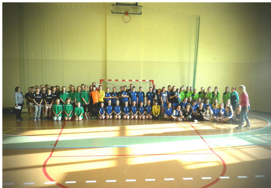
Gimnazjada Głowaczów 2014