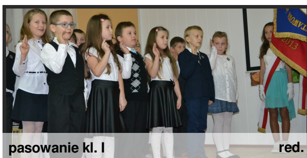
pasowanie kl. I