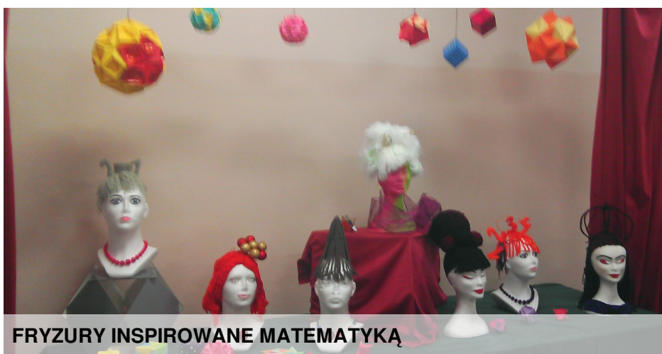
FRYZURY INSPIROWANE MATEMATYKĄ