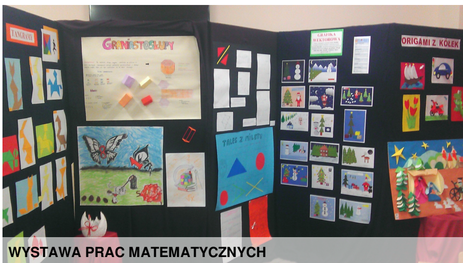
WYSTAWA PRAC MATEMATYCZNYCH