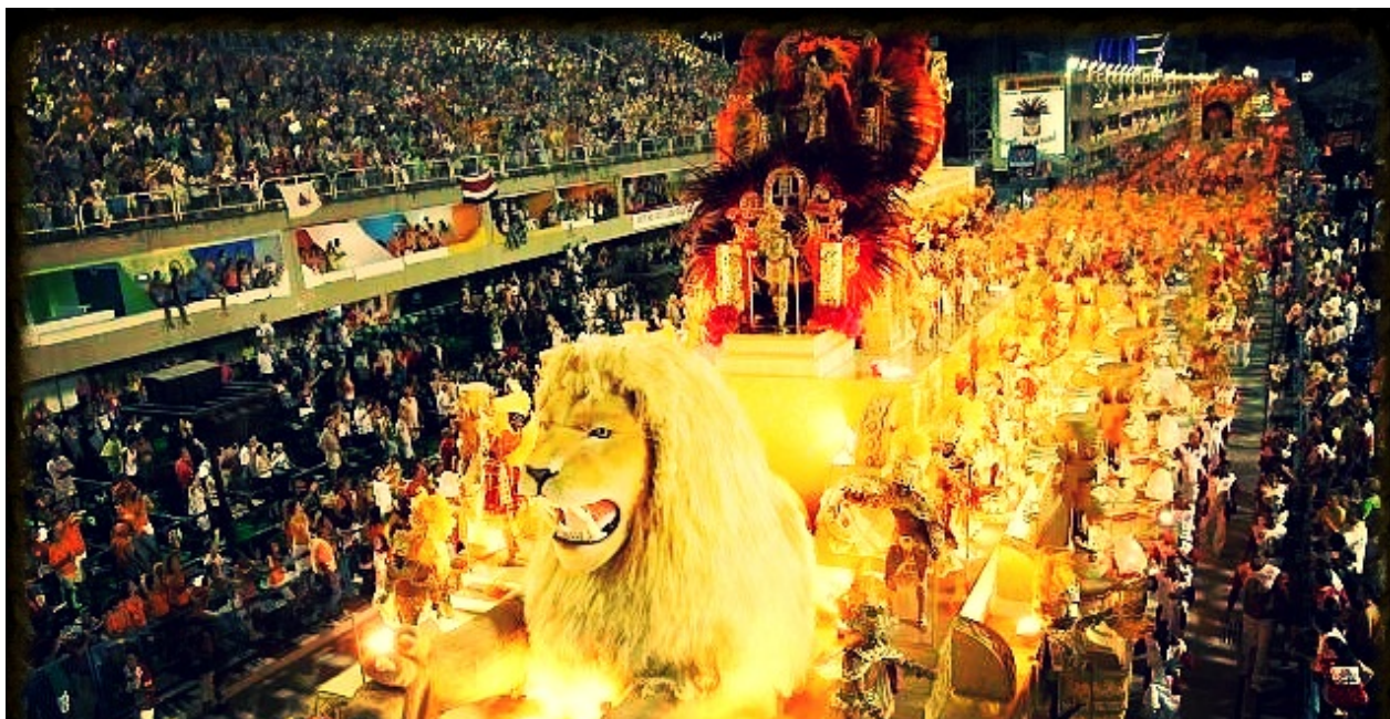
Karnawał w Rio de Janeiro