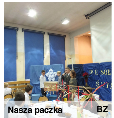
Nasza paczka BZ

Całość uroczystości przygotowali uczniowie i nauczyciele. Stoły i salę udekorowali słuchacze naszej Policealnej Szkoły Florystycznej. Oryginalne stroiki i kompozycje kwiatowe zaskoczyły swym urokiem i oryginalnością.