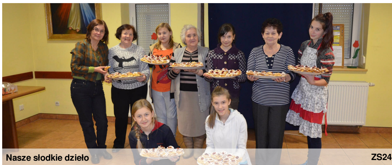
Nasze słodkie dzieło

sprzedane następnego dnia w ramach akcji „Pączek dla Afryki.” Sprzedawano też pączki dostarczone przez piekarnię Państwa Kibałów. Pozdrawiamy wszystkich, którzy z uśmiechem „pałaszowali” nasze róże karnawałowe i pączki, by pomagać.