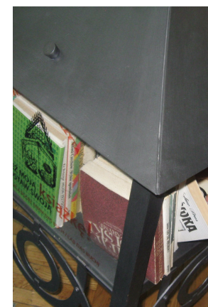
Książki czekają... BZ

Skrzynka stoi sobie dostojnie w holu leśnickiego Zamku na parterze i, jak wynika z obserwacji, jest odwiedzana. Pustoszeje dość szybko. Przypominamy, że książki powinny krążyć zgodnie z hasłem: Weź moją książkę, zostaw swoją. Zatem może warto przejrzeć półki w domu i przynieść coś na wymianę? Zapraszamy do dzielenia się lekturą!