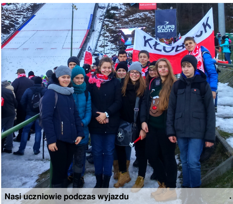
Nasi uczniowie podczas wyjazdu

W dniu 17 stycznia 2015r. zorganizowany został wyjazd na zawody Pucharu Świata w Zakopanem. W dopingowaniu naszych skoczków brało udział 15 naszych gimnazjalistów. Od początku pierwszej serii emocje sportowe rosły w narciarskim tempie, a niezapomniana atmosfera zawodów obecna była jeszcze długo po zakończeniu zakopiańskiego święta. Kibice z naszej szkoły wrócili bardzo zmęczeni, ale w znakomitych nastrojach, deklarując chęć powrotu pod Tatry w przyszłym sezonie.