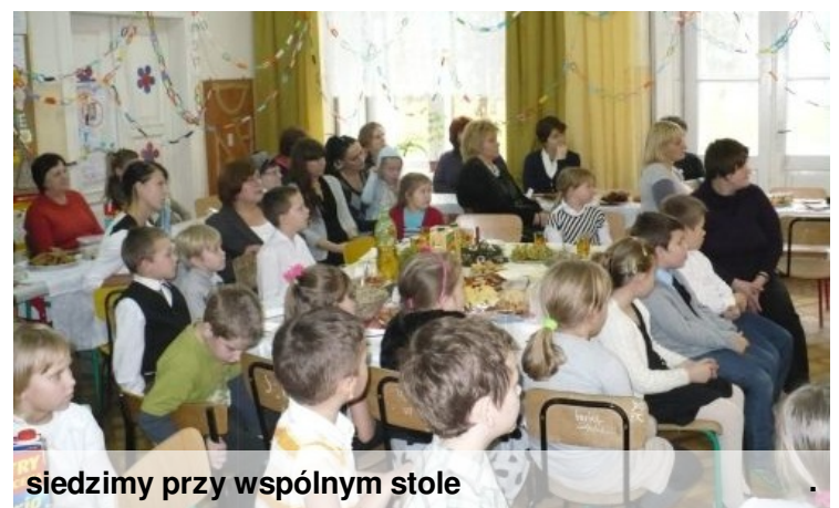
siedzimy przy wspólnym stole