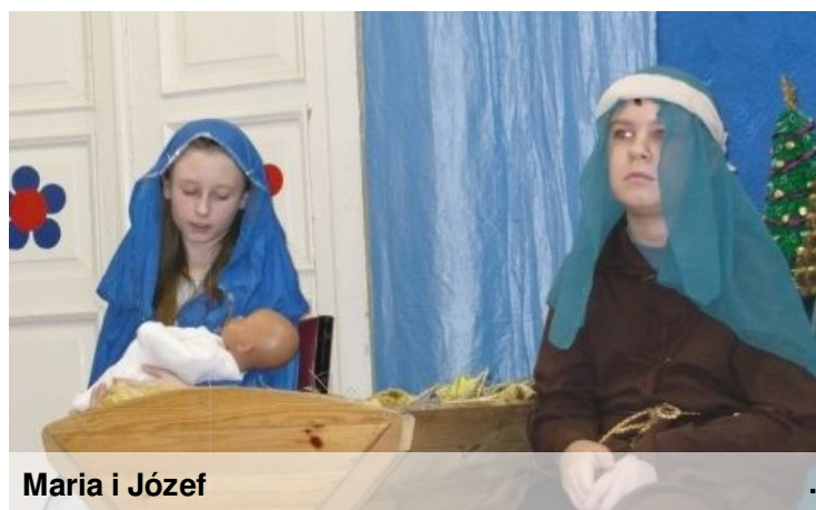
Maria i Józef