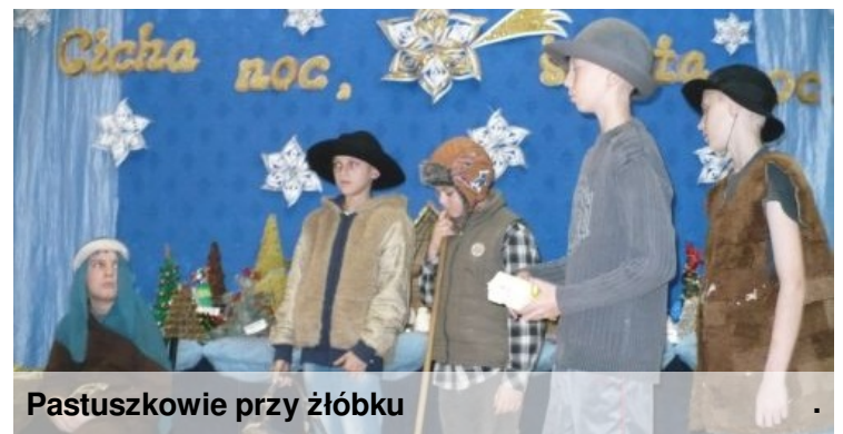
Pastuszkowie przy żłóbku

... i życzymy wielu sukcesów w szkole i poza nią!!!