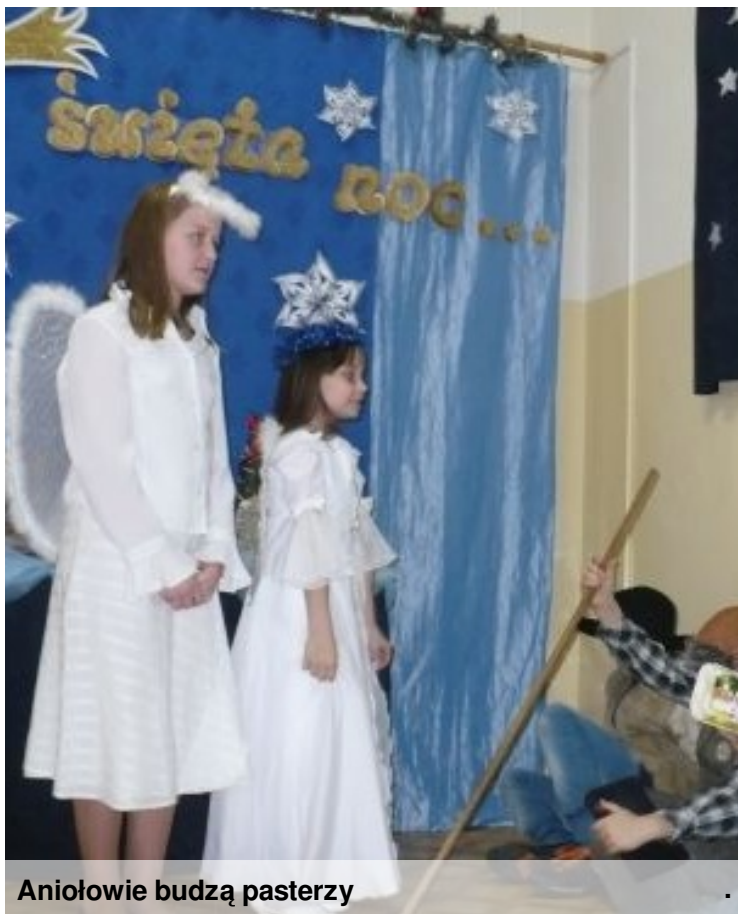
Aniołowie budzą pasterzy