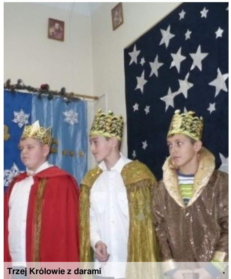
Trzej Królowie z darami