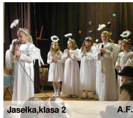
Jasełka, klasa 2