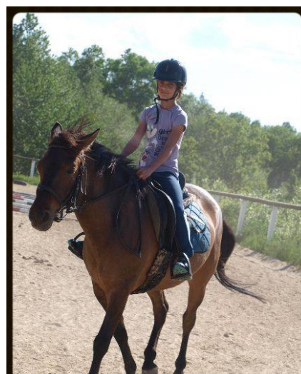
Jazda konna Oli