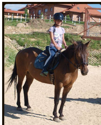
Ola na koniu