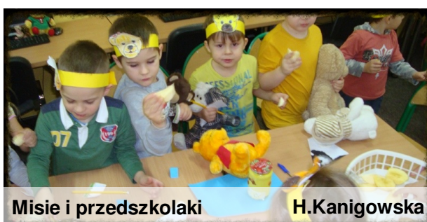
Misie i przedszkolaki