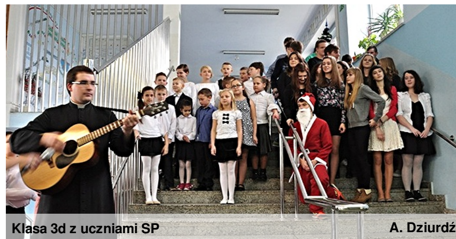
Klasa 3d z uczniami SP