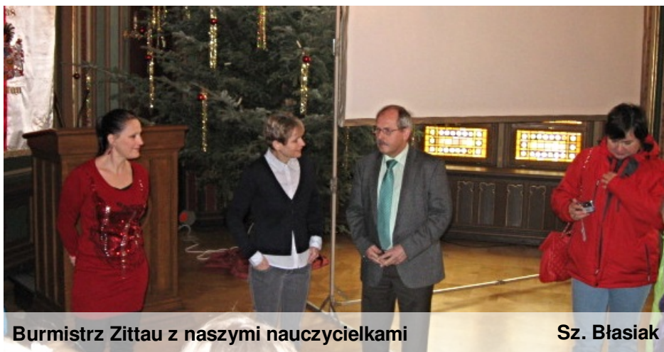
Burmistrz Zittau z naszymi nauczycielkami

Uważam, że nasz wyjazd był udany, dobrze, gdy zna się lepiej swoich sąsiadów. Wiosną pojedziemy do Czech i także zdamy Wam z tego relację.