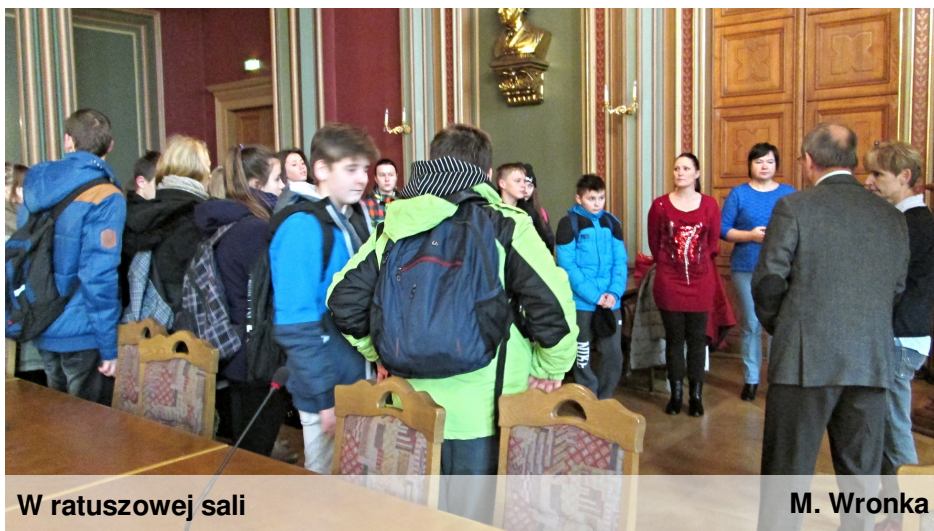
W ratuszowej sali