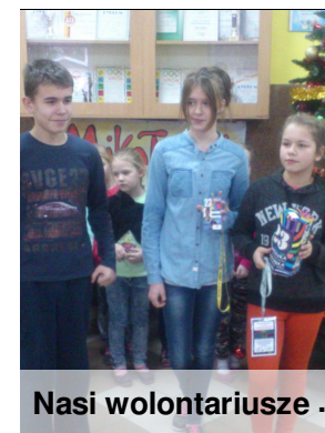
Nasi wolontariusze .