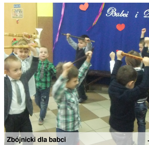
Zbójnicki dla babci