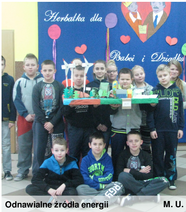
Odnawialne źródła energii