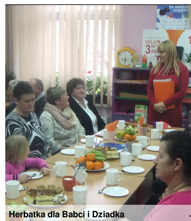
Herbatka dla Babci i Dziadka