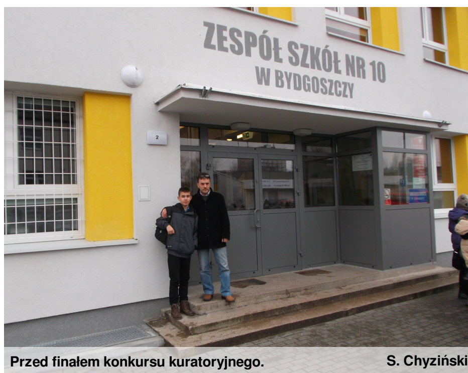
Przed finałem konkursu kuratorskiego.