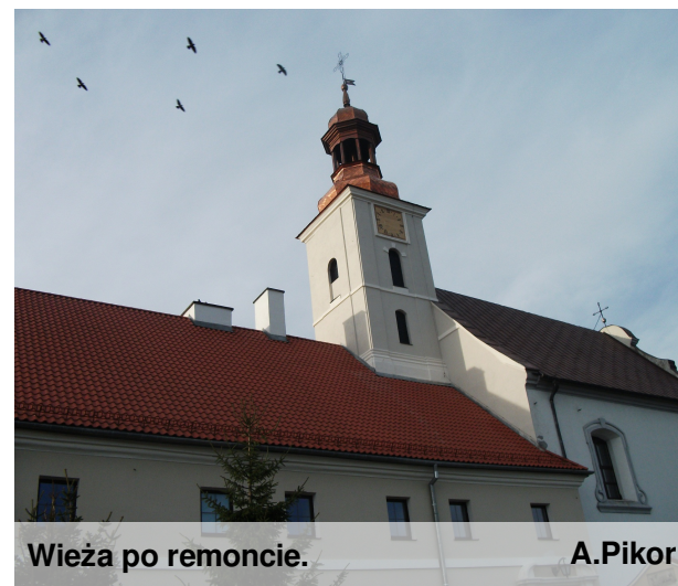
Wieża po remoncie.

Współpraca twórców nie miała granic. Więcej o konkursie na stronie 5.