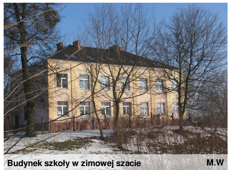
Budynek szkoły w zimowej szacie