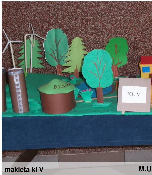
makieta kl V