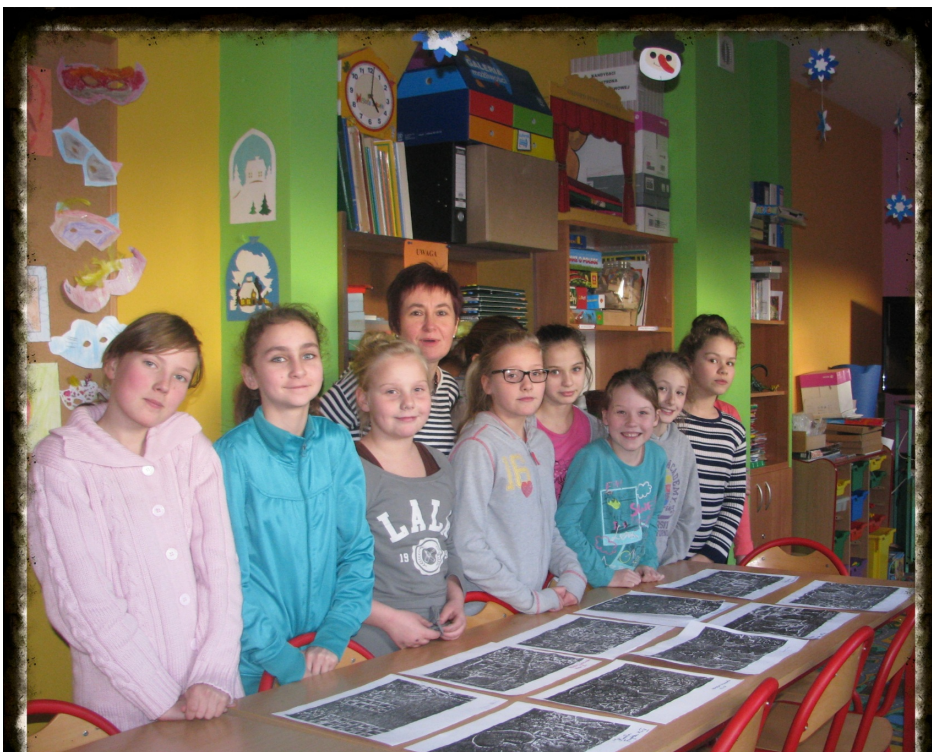
Uczestnicy Koła Plastycznego

Koło plastyczne prowadzone przez Panią Annę Sobocińską odbywa się w każdy czwartek i cieszy wielkim zainteresowaniem. Uczniowie pracują różnymi metodami plastycznymi, wystawę prac możemy obejrzeć w stołówce szkolnej. Gratulujemy naszym młodym artystom. M.W.