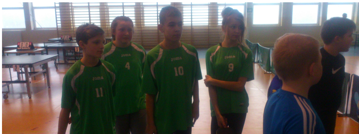
Nasi zawodnicy w Karnkowie