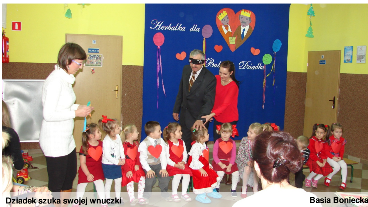
Dziadek szuka swojej wnuczki