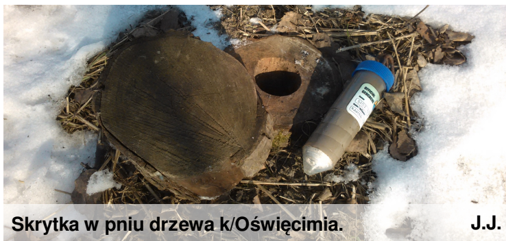
Skrytka w pniu drzewa k/Oświęcimia.