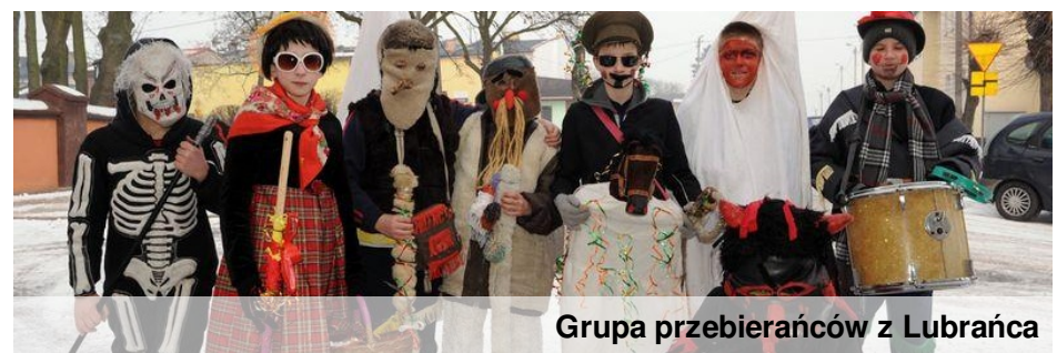
Grupa przebierańców z Lubrańca