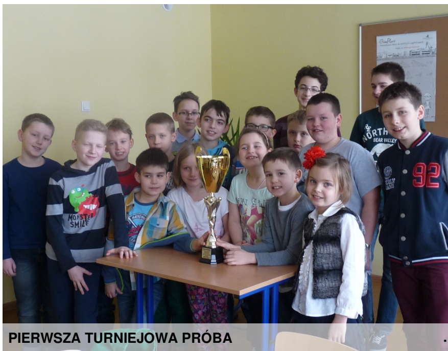
PIERWSZA TURNIEJOWA PRÓBA

Więcej o turnieju w zakładce: kółko "STO literek". Zerknij do nas.