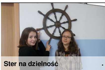
Ster na dzielność

swojego show. Nie szkodzi. Za 3 tygodnie otrzymamy wspólnie zrealizowany w studiu film. Ciekawe, jak wypadliśmy?