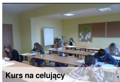
Kurs na celujący