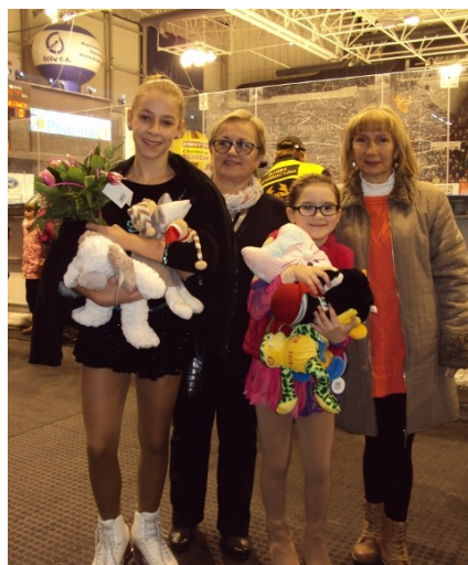
Lubię moją dzielność