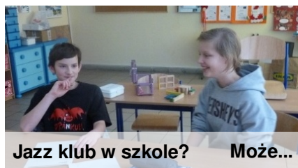
Jazz klub w szkole? Może...