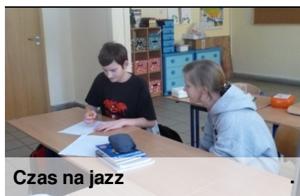
Czas na jazz