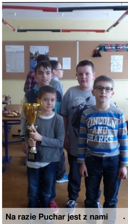
Na razie Puchar jest z nami