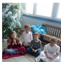
Już po turnieju