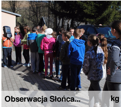
Obserwacja Słońca... kg

Częściowe zaćmienie Słońca nad Polską oglądaliśmy 20 marca 2015 r.