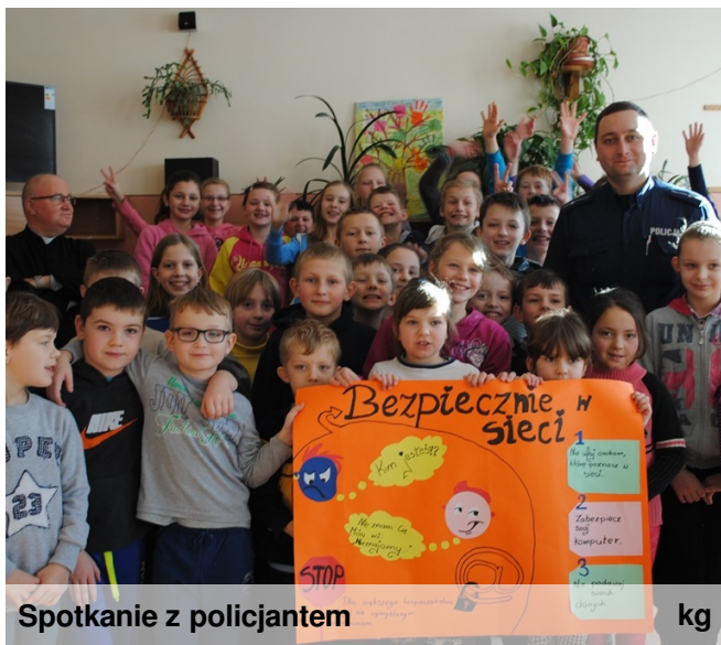
Spotkanie z policjantem