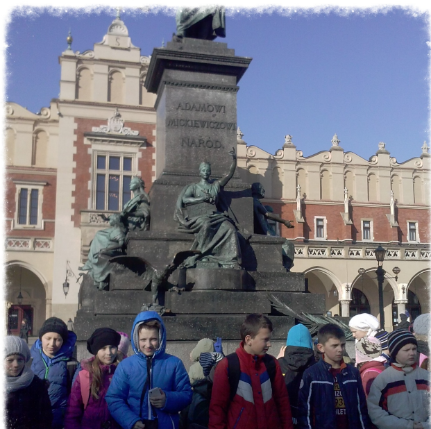
Pod pomnikiem Mickiewicza