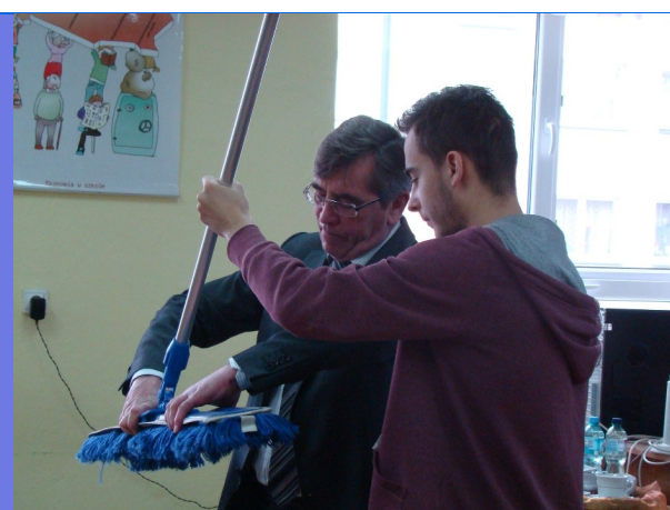
Instruktaż dyrektora firmy VOIGT

25 stycznia w Filharmonii Rzeszowskiej odbyło się spotkanie noworoczne zorganizowane przez Zarząd Wojewódzki Polskiego Stronnictwa Ludowego. W spotkaniu, wśród ponad 600 gości, znaleźli się m.in. wicepremier Janusz Piechociński, marszałek województwa świętokrzyskiego Adam Jarubas (kandydat na prezydenta RP), wiceminister sprawiedliwości Wojciech Węgrzyn, posłowie, wojewodowie, prezydenci i burmistrzowie miast, starostowie, wójtowie, radni samorządów wszystkich szczebli. Zespół Szkół nr 1 miał możliwość zaprezentowania swoich cukierniczych umiejętności. Goście zachwycali się sposobem prezentacji, dekoracją ciast i ich niezwykłym smakiem. Chwalili kunszt młodych adeptek sztuki kulinarnej i zapraszali na prezentacje do Warszawy.