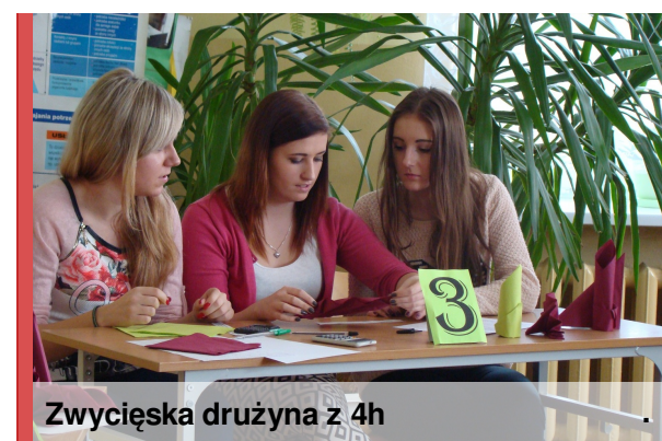
Zwycięska drużyna z 4h