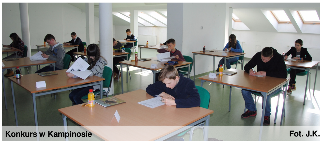
Konkurs w Kampinosie