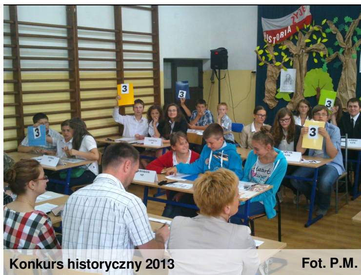
Konkurs historyczny 2013