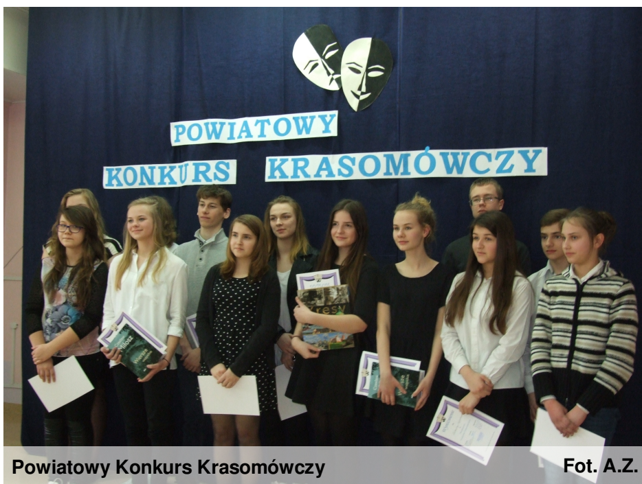
Powiatowy Konkurs Krasomówczy