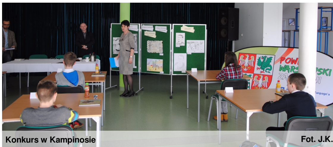
Konkurs w Kampinosie