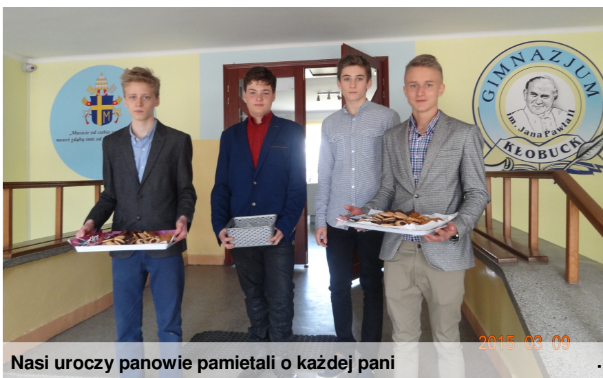
Nasi uroczy panowie pamiętali o każdej pani