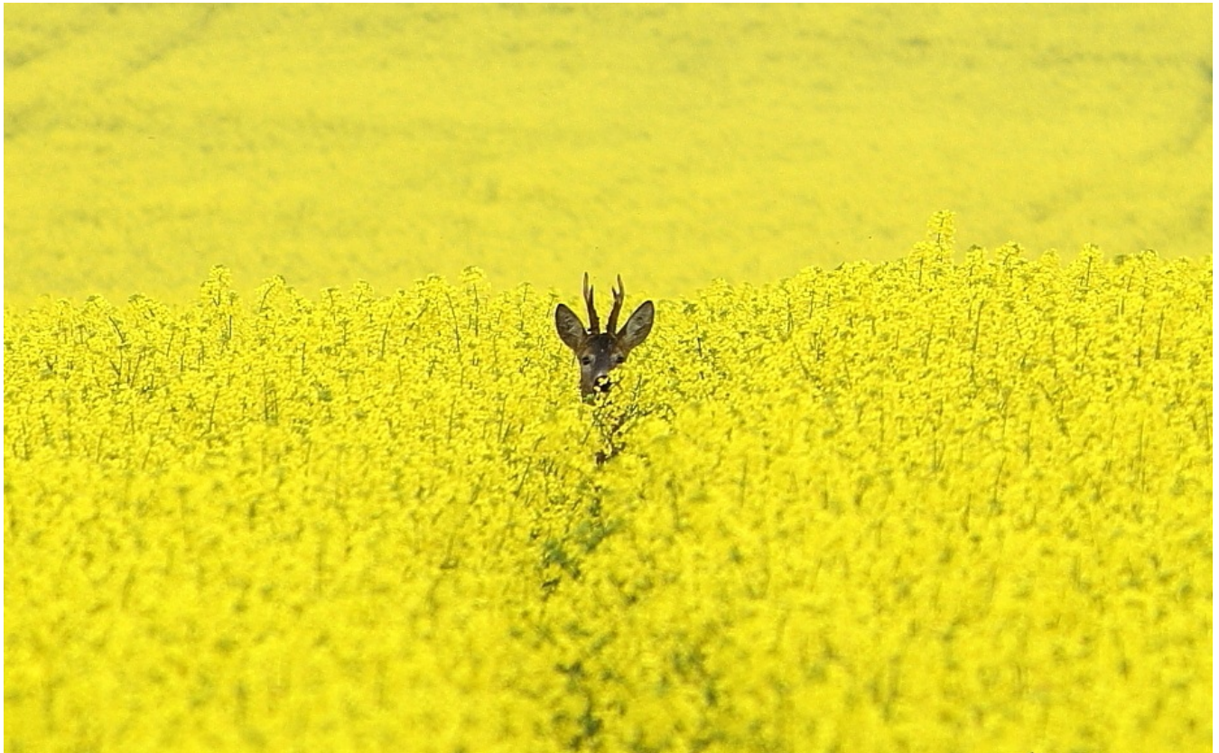
Aleksander Lis wykonanie: p.Aleksander Lis