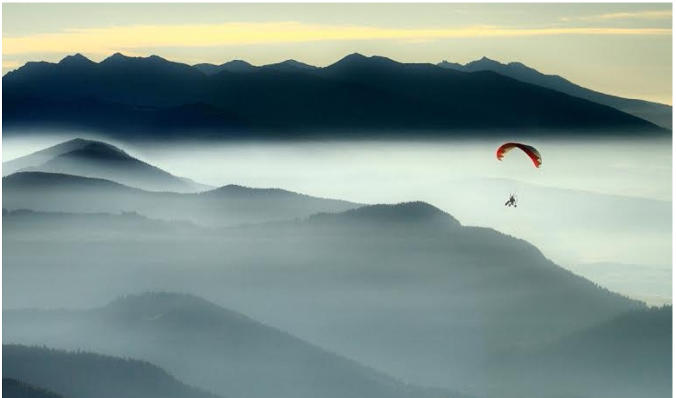
wykonanie: p.Aleksander Lis