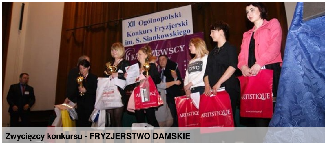
Zwycięzcy konkursu - FRYZJERSTWO DAMSKIE

W dniu 8 marca br. do zmagania o miano najlepszych fryzjerów w poszczególnych kategoriach, stanęło około 70 młodych osób z Wielkopolski i Ziemi Lubuskiej.