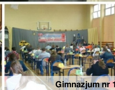
Konkurs języka angielskiego