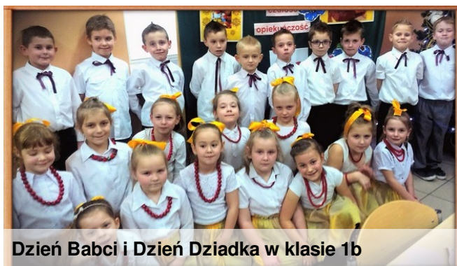
Dzień Babci i Dzień Dziadka w klasie 1b