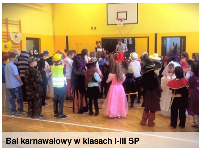
Bal karnawałowy w klasach I-III SP