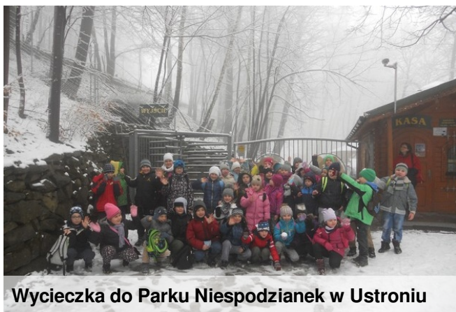
Wycieczka do Parku Niespodzianek w Ustroniu