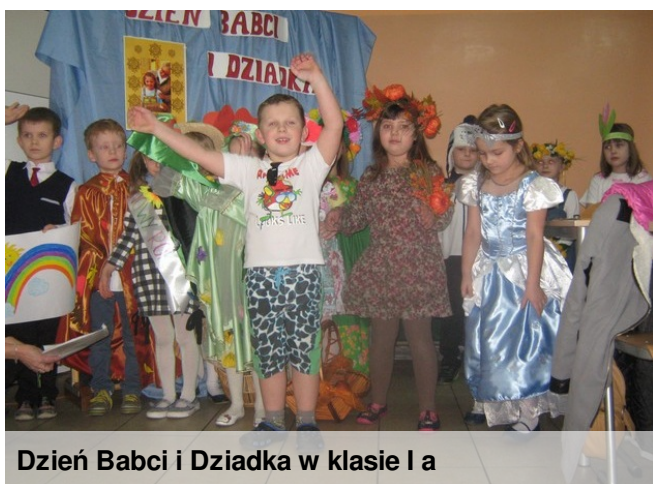
Dzień Babci i Dziadka w klasie I a