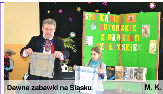
Dawne zabawki na Śląsku