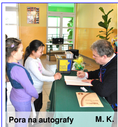
Pora na autografy