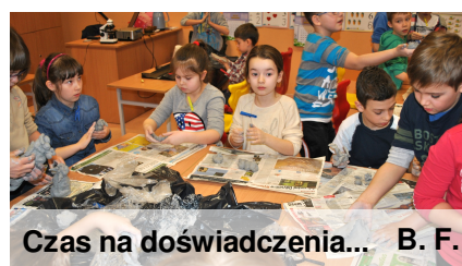
Czas na doświadczenia...