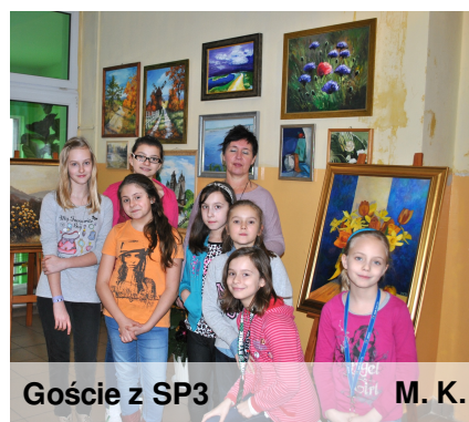
Goście z SP3