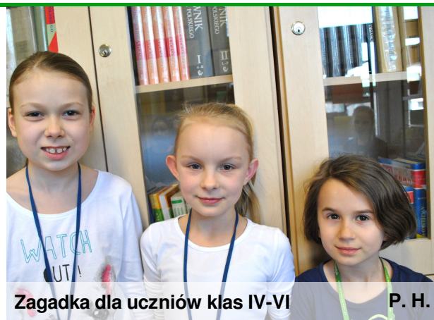
Zagadka dla uczniów klas IV-VI