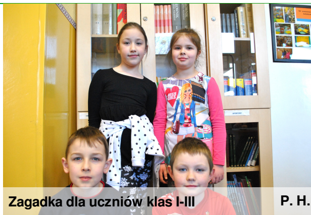
Zagadka dla uczniów klas I-III