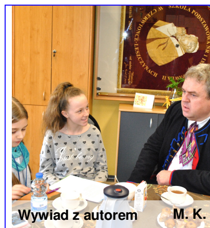
Wywiad z autorem