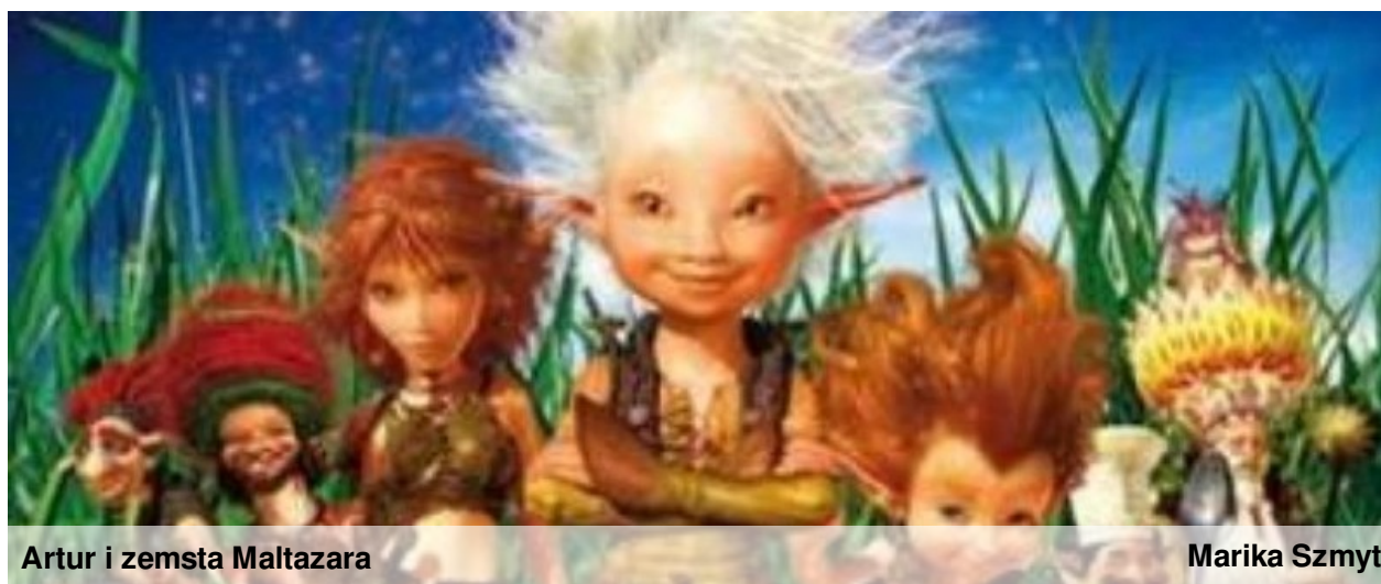
Artur i zemsta Maltazara