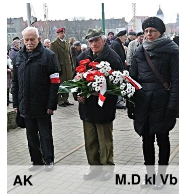
AK M.D kl Vb

W Poznaniu uczczono w piątek 73. rocznicę akcji "Bollwerk" - podpalenia niemieckich magazynów w poznańskim porcie rzeczonym. Przeprowadzoną w lutym 1942 roku akcją uznaje się za największy atak ruchu oporu w Wielkopolsce w czasie II wojny światowej. M.D Vb