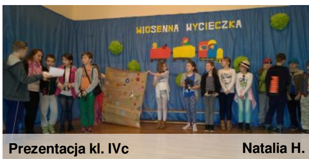
Prezentacja kl. IVc