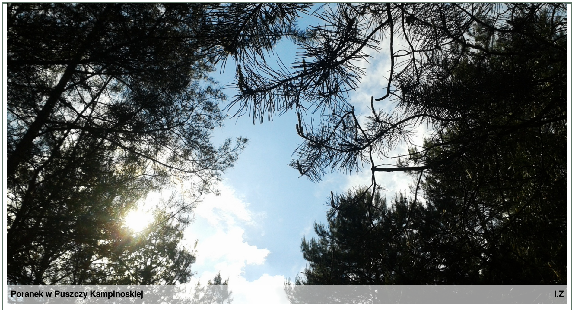
Poranek w Puszczy Kampinoskiej