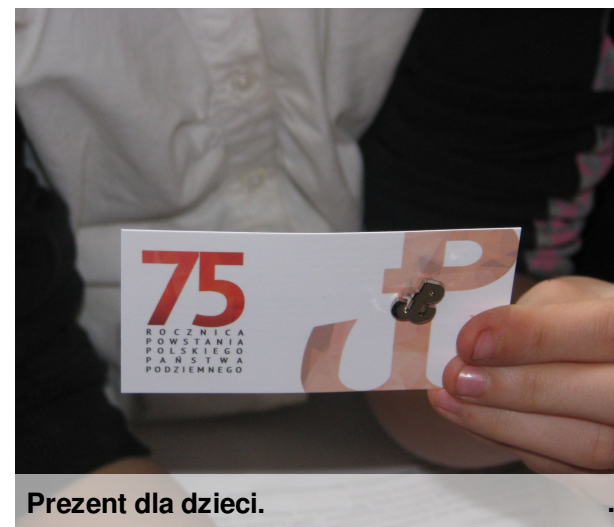
Prezent dla dzieci.