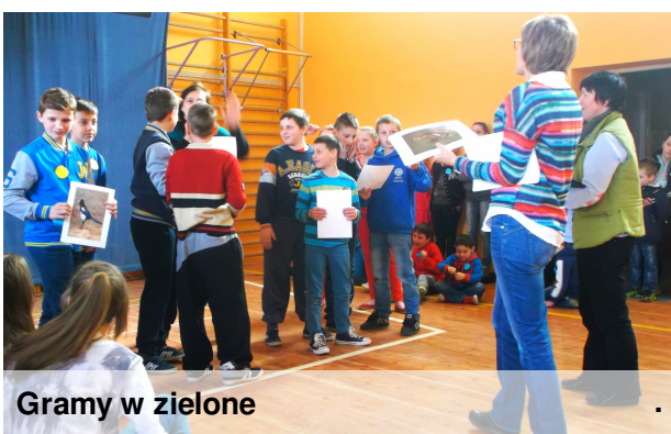
Gramy w zielone