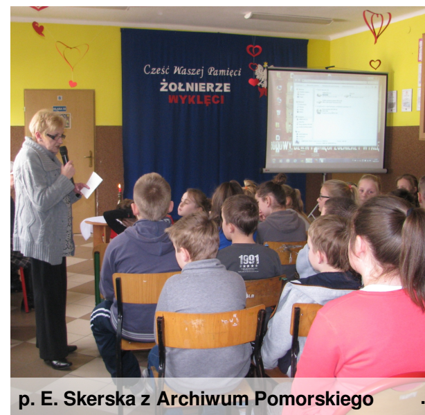
p. E. Skerska z Archiwum Pomorskiego

Urodziła się 19 marca 1909 r. w pruskim wówczas Toruniu. Po ukończeniu tamże niemieckiej szkoły podstawowej i zdaniu matury w Żeńskim Gimnazjum Humanistycznym ukończyła studia matematyczne na Uniwersytecie im. Adama Mickiewicza w Poznaniu. Przed II wojną światową uczyła w szkołach średnich i jednocześnie działała społecznie jako instruktorka Przynależności Wojskowej Kobiet.