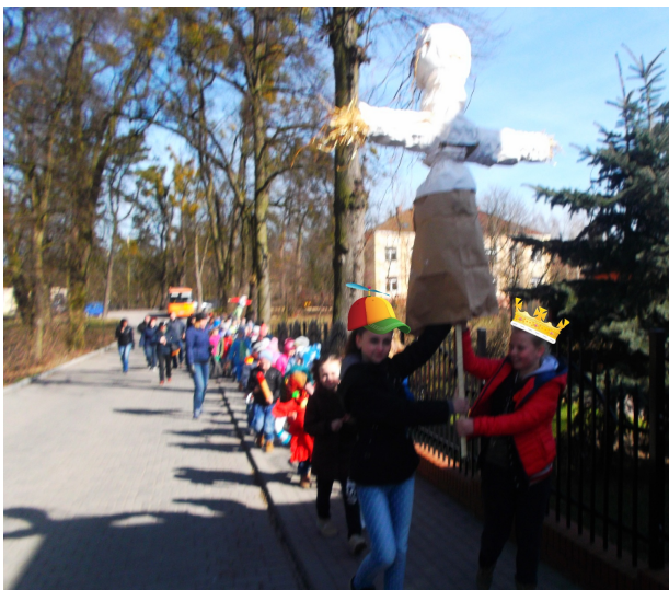
Wiosna ach to ty...