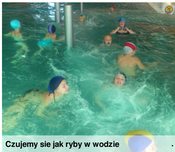
Czujemy się jak ryby w wodzie