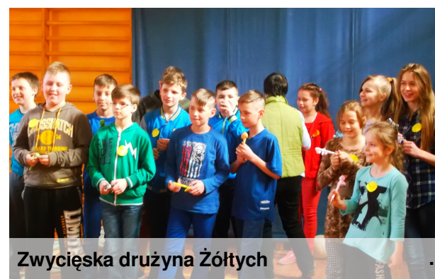
Zwycięska drużyna Żółtych