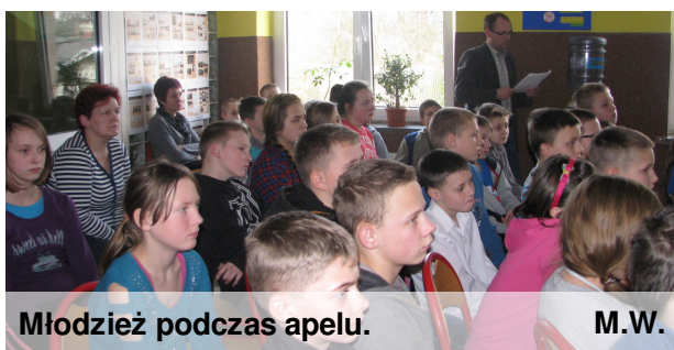
Młodzież podczas apelu.