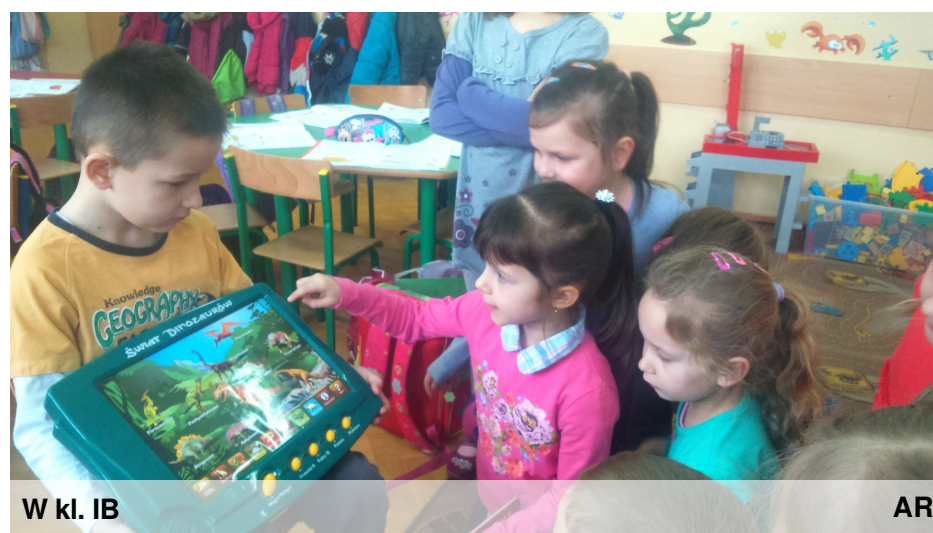
W kl. IB