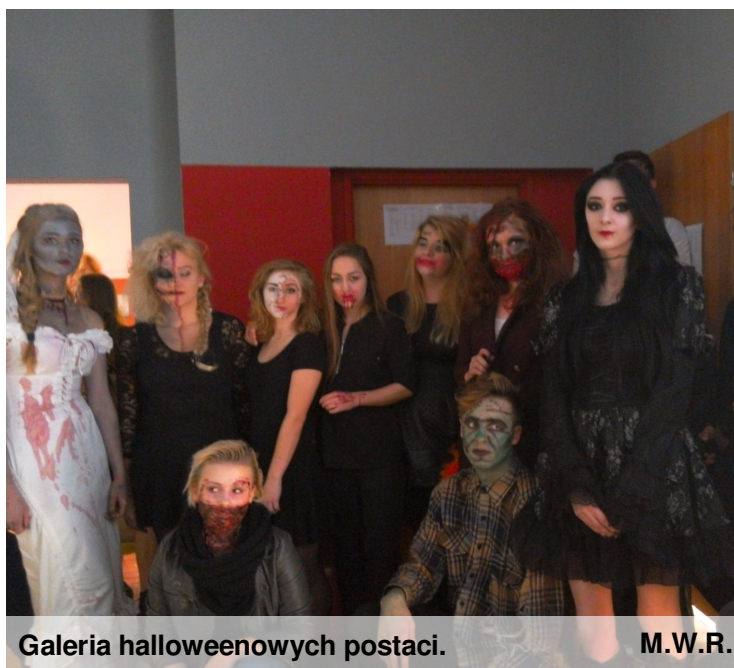
Galeria halloweenowych postaci.