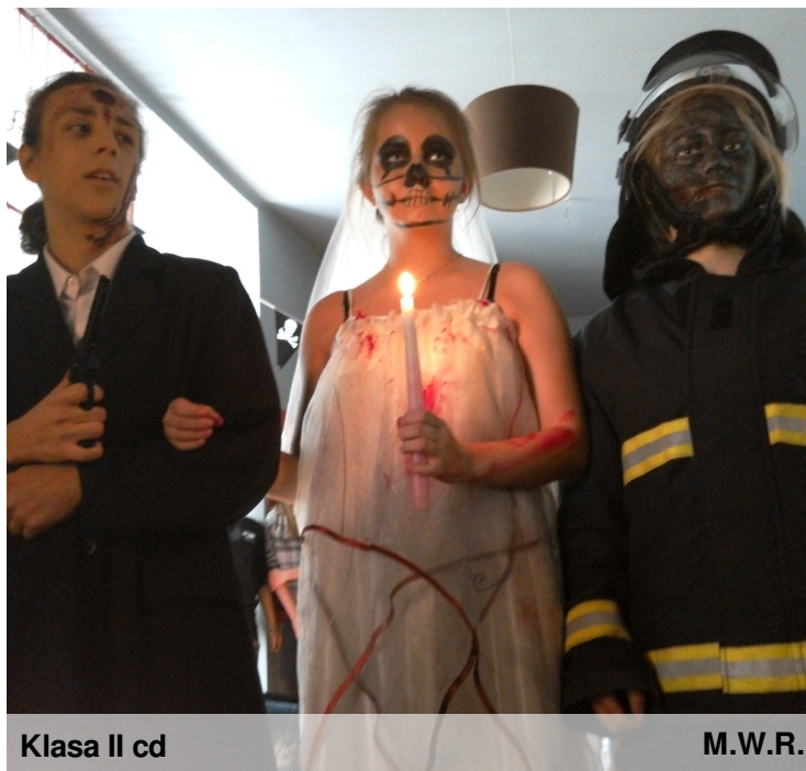
Klasa II cd