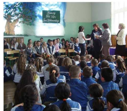
fot. wręczenie nagród