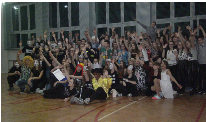
Niech żyje bal!