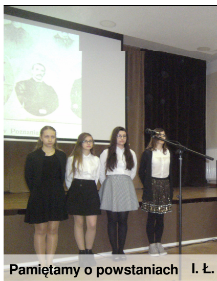
Pamiętamy o powstaniach I. Ł.